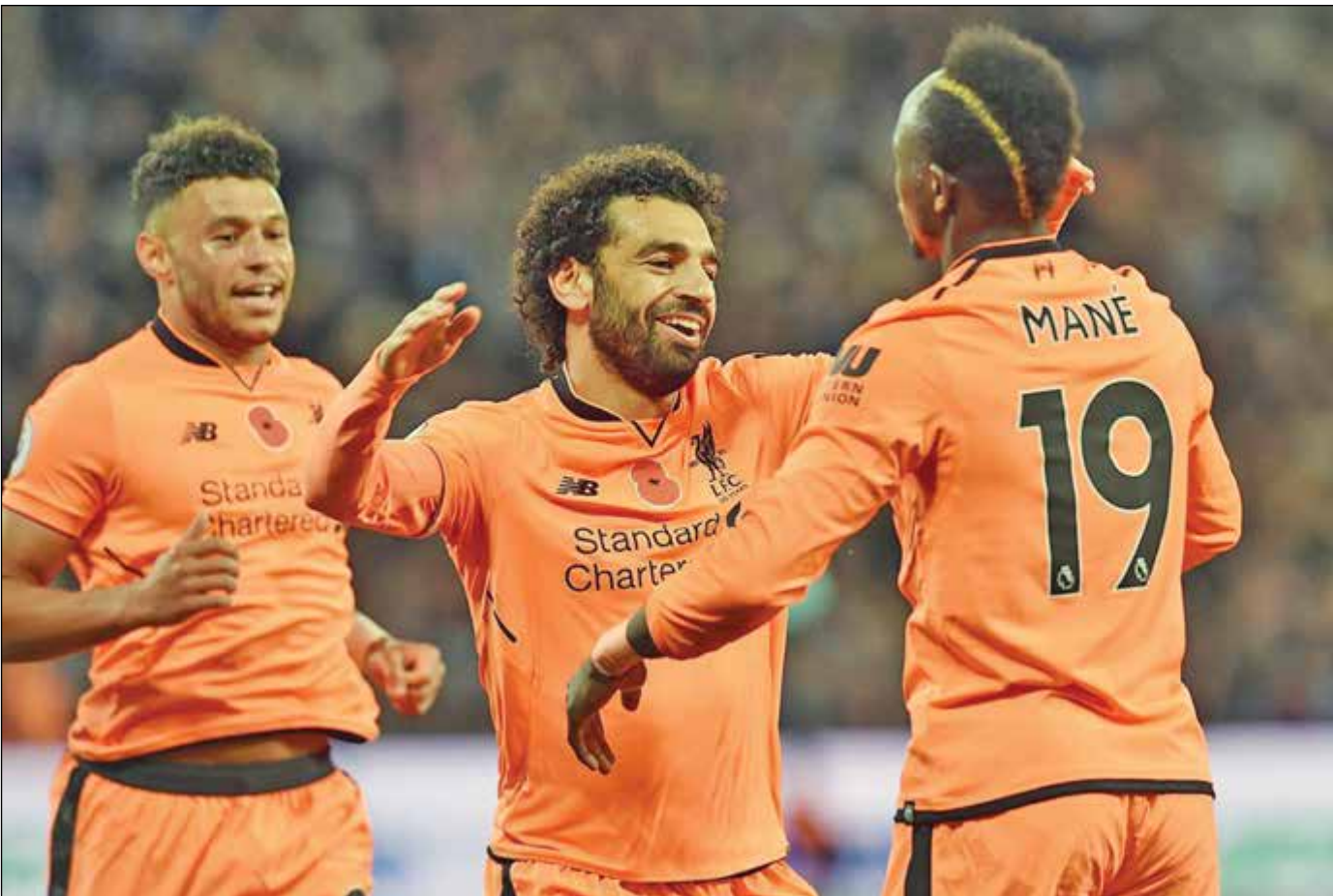
• تشامبرلين مع صلاح وماني

وفي حوار مع شبكة «بي بي سي»، طلب من تشامبرلين إكمال تلك الجملة «محمد صلاح ليس أنانياً بسبب...»، وحينها أجاب مازحاً: «ليس أنانياً؟ هذا الفتى لا يمرر