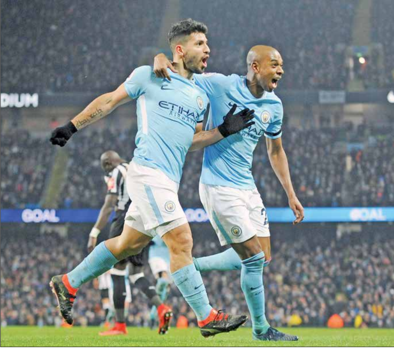
• أغويرو يحتفل مع فرناندينيو

هز مهاجم مانشستر سيتي سيرجيو أغويرو الشباك من نقطة الجزاء في مباراة فريقه أمام واتفورد على ملعب «الاتحاد»، ضمن منافسات الجولة السادسة من الدوري الانكليزي الممتاز لكرة القدم.