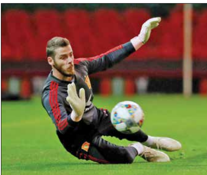
• دي خيا

بصر الإسباني دافيد دي خيا، حارس مرمى مانشستر يونايتد، على أنه سعيد بمستواه في الموسم الماضي، على الرغم من سلسلة من الأخطاء البارزة التي ارتكبها، مؤكداً أن مفاوضات تجديد عقده لم تؤثر عليه.