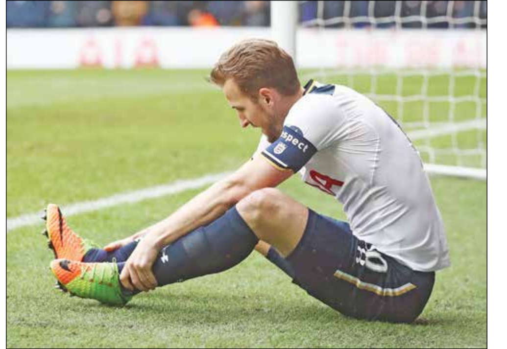
• هاري كين

واصل نجم توتنهام هاري كين التالق أمام فريسته المفضلة ليدرس سيتي، أول من امس السبت، في اللقاء الذي جمع الفريقين ضمن الجولة السادسة من الدوري الانكليزي الممتاز.