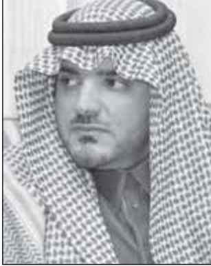
• الأمير عبدالعزيز بن سعود

وأضاف: «ثم جاء من بعده أبناؤه الكرام البررة وواصلوا المسيرة إلى عهد قائد الإنجاز والنماء خادم الحرمين.