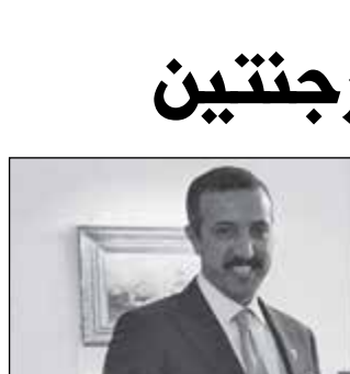
• أوسكار راؤول

اجتمع وزير الدفاع الأرجنتيني د. أوسكار راؤول، في العاصمة بوينس آيرس، بوكيل وزارة الخارجية البحرينية للشؤون الدولية د. الشيخ عبدالله بن أحمد، وذلك خلال زيارة العمل الرسمية التي يقوم بها إلى الأرجنتين.