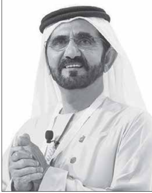
• محمد بن راشد

ويحاكي برنامج «القيادات المؤثرة» في مساقته المتقدمة أحدث التوجهات العالمية في تخصص تأهيل وإعداد قيادات متميزة، وقد تم تصميم البرنامج بالاستناد إلى مقومات المنظومة القيادية للشيخ محمد بن راشد وبالشراكة مع جامعات عالمية ثلاث هي «يو سي بيركلي» في الولايات المتحدة الأميركية، وكلية «إمبريال كوليدج لندن»، والمعهد الدولي للتطوير الإداري «أي أم دي» من سويسرا.