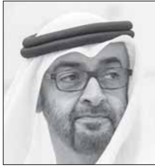
• محمد بن زايد

التي تحيط بها، وأضاف بن زايد عازمون على تعزيز تضامنا وتكاملنا لخير بلدنا والمنطقة. كما توجه بن زايد بالتهنئة لضام الحرمين الشريفين الملك سلمان بن عبدالعزيز والشعب السعودي الشقيق باليوم الوطني 89.. يومكم هو يومنا.. وفرحكم فرحنا، وإنجازتكم فخر لنا..