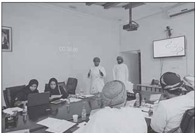
• جانب من فعاليات تصفيات المرحلة الثانية لجائزة الابتكار

محاور فكرة الابتكار والتميز، وبناء النموذج، ووضوح الفكرة المستفيدة، والجدوى الفعلية للابتكار، والتقرير الفني للنموذج، وخطة تحويله للمنتج للابتكار النهائي.