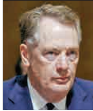
• روبرت لايتهايزر

التي هي صحيفة نيكي التجارية المتحدة واليابان توصلتا إلى إطار العام لاتفاق تجاري مع إبقاء الولايات المتحدة للتعريفات الجمركية على السيارات اليابانية ولكن مع خفض طوكيو للتعريفات على لحوم الأبقار والخنازير الواردة من الولايات المتحدة. وأضافت الصحيفة أن الممثل التجاري الأميركي روبرت لايتهايزر ووزير الاقتصاد