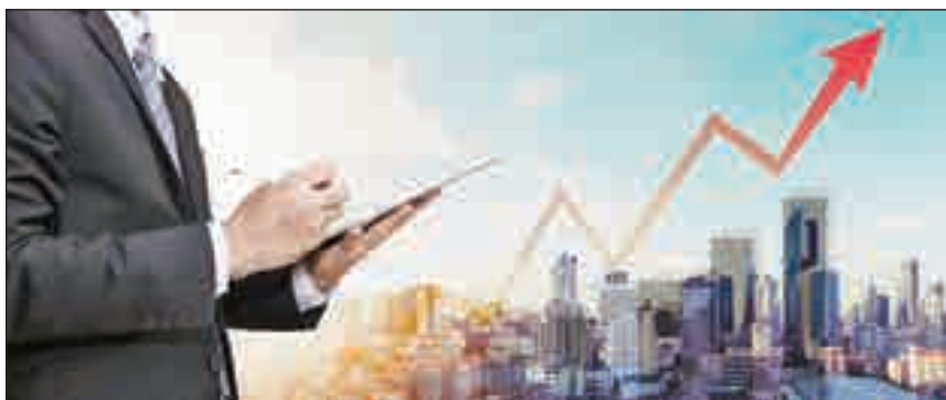
• أكثر ما يميز مجال الاستثمار المعرفة التراكمية

من الخبرة والمعرفة ما يسمح له باكتساب الخبرة والمعرفة بمعدل أسرع من غيره. لذلك، كم الأفكار المفيدة التي يستطيع «مونجر» استخلاصها من قراءته للـ«ايكونوميست» سيكون أكبر بكثير مقارنة مع أي شخص آخر. وسيصبح «مونجر» مرة أخرى أكثر ذكاءً. ربما أكثر ما يميز مجال الاستثمار هو أن المعرفة التي تكتسبها فيه كمستثمرين تراكمية بطبيعتها، فعندما تقوم مثلاً بدراسة أساسيات شركة معينة أثارت اهتمامنا فإننا نكتسب معرفة حول الشركة ونقاط قوتها وضعفها وحول الصناعة التي تعمل بها، حتى لو قررنا في النهاية عدم الاستثمار فيها أصلاً. الفكرة ببساطة هي أنه بمجرد أن يتراكم لدينا قدر معين من المعرفة فإن أي إضافة لتلك القاعدة تزيد من قيمتها بشكل كبير. ويحكي المستثمر ورجل الأعمال الهندي الأميركي «موهينيش بابراي» كيف أن معرفته بصناعة شحن النفط -التي اكتسبها أثناء دراسة أسهم لم يستثمر فيها في النهاية- ساعدته على إيجاد صفقة أخرى مربحة.