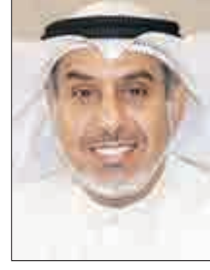
• فهد الشعلة

شدد وزير الدولة لشؤون البلدية فهد الشعلة على ضرورة تكثيف واستمرار الجولات الميدانية لقطاع الرقابة والتفتيش على إدارات السلامة بافرع البلدية بالمحافظات الأطلاع على سجلاتها والتراخيص الصادرة منها وعلى محاضر المخالفات المحررة وكافة أعمالها للتأكد من مطابقتها للنظم واللوائح المعمول بها والتحقق من مدى التزام تلك الإدارات بنظام الميكنة والإرشيف الإلكتروني لمعاملاتها صادرة والواردة إليها بسجل خاص يبين فيه اسم الموظف الثلاثي وتوقيعه وتاريخ استلامه للمعاملة. وقال الشعلة في خطابه الموجه إلى رئيس قطاع الرقابة والتفتيش التابع لمكتب الوزير أن توصيات لجنة مراجعة الإجراءات التي اتخذتها بلدية الكويت بشأن التعديلات على املاك الدولة المشككة بقرار وزاري اوصت أيضا على عمل ملف فني لكل مشروع حكومي أو خاص تابع للمحافظة تودع فيه أصول التراخيص والموافقات التنظيمية ونسخ عن المخالفات وكافة الأوراق المتعلقة بالمشروع وايصالات التحصيل والمراسلات التي تتم بخصوص الموقع مع كافة الجهات منذ بداية العمل وحتى انتهاء العمل فيه يحفظ في أرشيف الإدارة ورفع التقارير اللازمة لوزير البلدية.