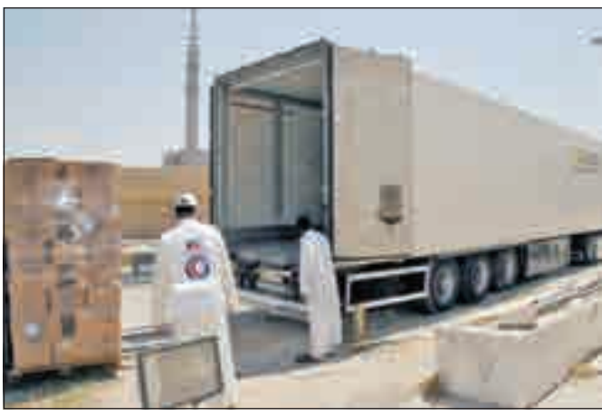
• خلال توزيع الموسوعة الإملائية لصغار لاجئي سورية