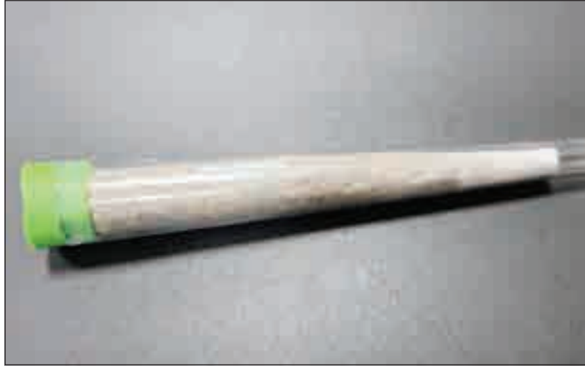
• الكوكايين الذي تم ضبطه