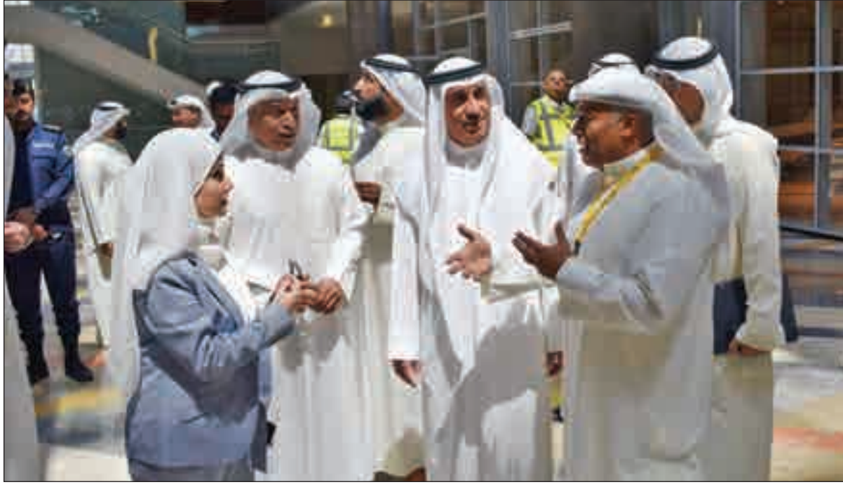
... ويستمعان إلى شرح عن المشروع