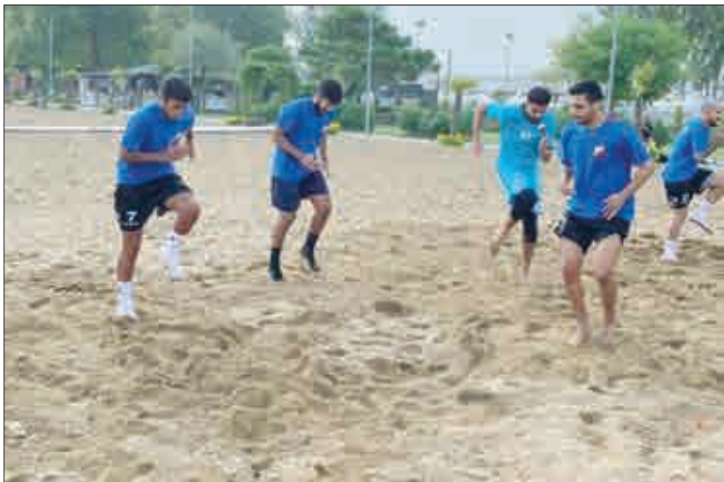
• جانب من تدريبات خيطان بتركيا