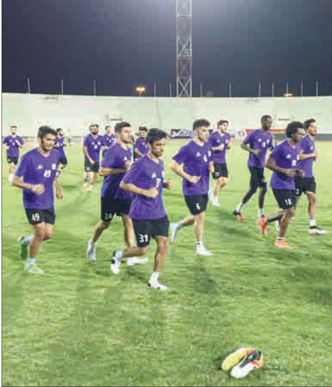
• جانب من تدريبات سابقة للعربي