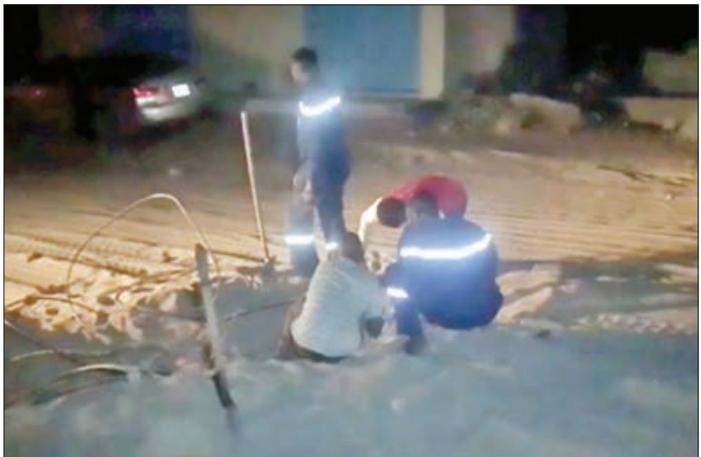
• فلام في منطقة المنقف

محدودة ويتم التعامل معها فور ورود البلاغ الى الوزارة. وأكد المصدر ان ارتفاع درجات الحرارة يؤدي لضغط على الشبكة، فيستبب بوجود انقطاعات، البلاد على مستوى العالم بنسبة انقطاع التيار الكهربائي والأعطال في الشبكات، وذلك حسب التقارير المعروضة امام اللجان العاملة المختصة.