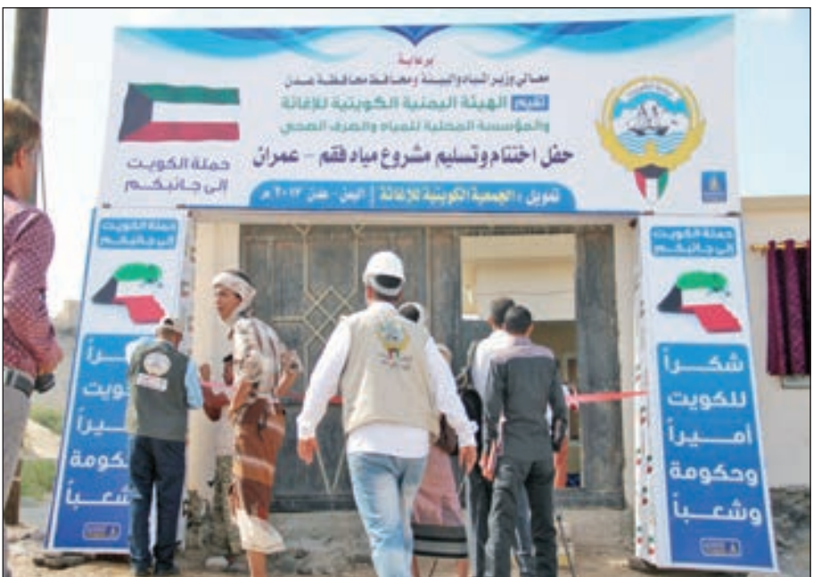
• من مراسم تسليم مشروع مياه فقم - عمران بتحويل كويتي

في تخفيف حدة أزمة أوشتك أن تحول إلى كارثة حقيقية تلك الحرت والنسل». ولفت إلى أن الجمعية سجلت نحو 2.7 مليون مستفيد من مشاريع المياه و1.7 مليون مستفيد من مشاريع الغذاء والإيواء التي دعمتها الكويت عبر الجمعية و1.1 مليون مستفيد من المشاريع الصحية و141 ألف مستفيد من المشاريع التعليمية. وأكد أنه لا توجد مديرية واحدة في اليمن تخلو من بصمة شاهدة للكويت وعطائها اللامحدود وهي البصمات والشواهد التي أسهمت في إعادة الاستقرار للبلاد ودفع عجلة الحياة إلى الأمام.