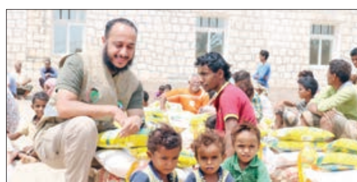
• استمرار العطاء الكويتي للشعب اليمني

وأوضح أن الدور الإغاثي الكويتي في اليمن تزايد بعد الحرب بشكل ملموس وخففت الإغاثة التي قدمتها مؤسسات وجمعيات كويتية من الآثار الإنسانية الكارثية التي خلفتها الحرب. وأشار إلى أن «الدور التنموي الكويتي قديم في اليمن ولا تكاد تجد مدينة يمنية ليس فيها مدرسة أو مستشفى قدمت الكويت هدية للشعب اليمني». وقال «حيفاً بيمت وجهك في اليمن اليوم فسجد بصمة خير كويتية وهذا ما عهدناه عن الأشقاء في دولة الكويت الذين يقدمون بصمت وإيثار ومحبة».