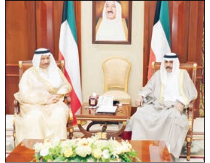
• سمو ولي العهد مستقبلاً سمو الشيخ جابر المبارك