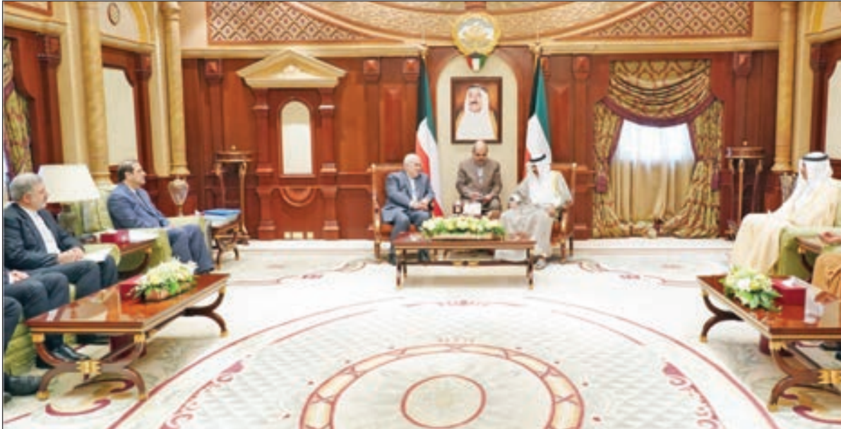
• ... ومستقبلاً الشيخ صباح خالد ومحمد ظريف

كما استقبل سموه نائب رئيس مجلس الوزراء ووزير الخارجية الشيخ