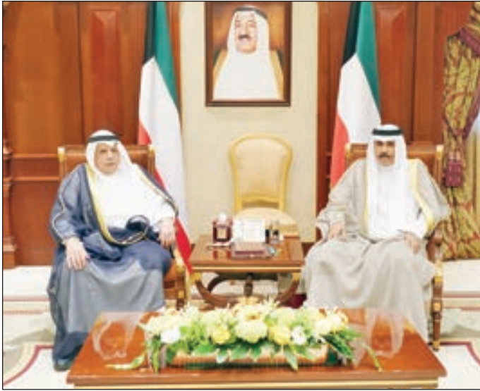
• سموه مستقبلاً الشيخ خالد الجراح

وكان وزير الطاقة والصناعة والثروة المعدنية السعودي المهندس خالد الفالح أعلن في وقت سابق تعرض حفل «الشبية» البترولي الواقع جنوب شرقي المملكة لاعتداء بطائرات مسيرة بدون طيار مفخخة مخلفا أضرارا محدودة.