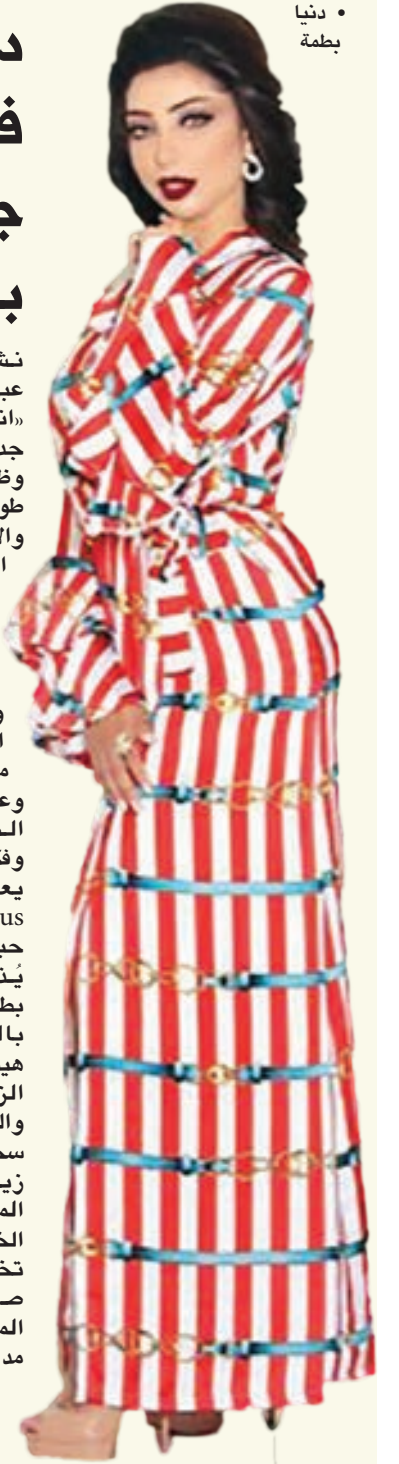
• دنيا بطمة

نشرت الفنانة دنيا بطمة عبر حسابها الخاص بموقع «انستغرام» صور لها بإطلالة جديدة مرتدية العباءة. وظهرت دنيا بطمة بعباءة طويلة مخططة باللون الأحمر والأبيض، ويشعر موج على الكتف، وماكياج جريء يتحلى بالبروج النبتية الغامق. ومن اللافت أن دنيا لم ترتد العباءة من قبل ولكنها أثار إعجابها الشديد بها، وذكرت أنها من تصميم «مايا تيسوس» وعلقت: «حببت العباية الصراحة مميزة ومختلفة وفكرة جديدة وثوب جميل يعطيك الصحة حبيبتى @ mayatissus على التصميم حبيبت». يُذكر أن آخر أعمال دنيا بطمة أغنية «الزمن بيدور» باللهجة المصرية، من كلمات هيثم شعبان، وألحان هيثم الزيات. والجدير بالذكر أن بطمة سجلت أغنيته الجديدة بعد زيارة قامت بها إلى ضريح الملك المغفور له الملك محمد الخامس، ملك المغرب، تخليداً لذكرى وفاته التي صادفت يوم 16 مايو الماضي، بأحد استوديوهات مدينة الرباط.