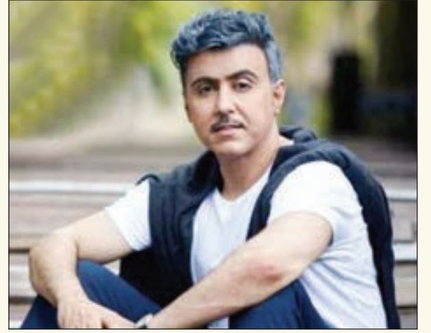
• جواد العلي

طرح الفنان جواد العلي أغنيته الجديدة عبر «يوتيوب» بعنوان «قلبي حلف»، والتي من كلمات الفارس والحنان السهب وتوزيع كرم أوكتان. وكان العلي قد عاد إلى الساحة الفنية مجدداً مع بداية العام بعد فترة طويلة من الغياب وذلك بأغنية «ما يهيم»، وفاجأ متابعيه حينها بملامحه التي تغيرت كثيرا، نظرا لطول غيابه الفني، حيث طبلوك جديد، وظهر بخصلات شعر بيضاء غيرت ملامحه. ينظر إلى أن أغنية «ما يهيم» من كلمات الولهان، الحان أسير النغم، وتوزيع كرم أوكتان. أما اللون الغنائي، الذي انتهجه في عمله الجديد، فجاء مشابها إلى حد كبير مع اللون الذي اعتاد على تقديمه سابقا بالايقاع السريع، وإدخال النوتة الموسيقية الحديثة. ويعود الألبوم الأخير الذي طرحه العلي إلى العام 2016، وحمل عنوان «متى نتشاق».