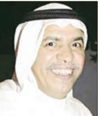
• عبدالله الحبيب

نرسلها الى الفنان الكبير عبدالله الحبيب الذي اشتاق جمهوره لأعماله الهادفة، نحن نعلم أن الفن الكويتي تراجع الى الوراء وأن هذا سبب غيابه عن الساحة ولتتمسك لك العذر ولكن لانريد للفن الكويتي الرائد ان يتراجع أكثر فمآزال الناس يتذكرون أعمالك الجميلة منذ مسرحية «حفلة على الخازوق» وحتى مسرحية «الإرهابي» وكذلك أعمالك الدرامية من يدايك في «افتح يا سمس» وحتى آخر عمل «المتنبي قاهر الذل»، نتمنى صادقين عودتك الى الفن ابا محمد فالفن بجاحتك وبحاجة الى جيلك الرائع.