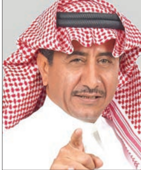
• ناصر القصبي