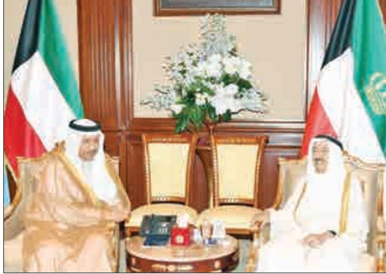
•... وخلال استقباله سمو الشيخ جابر المبارك