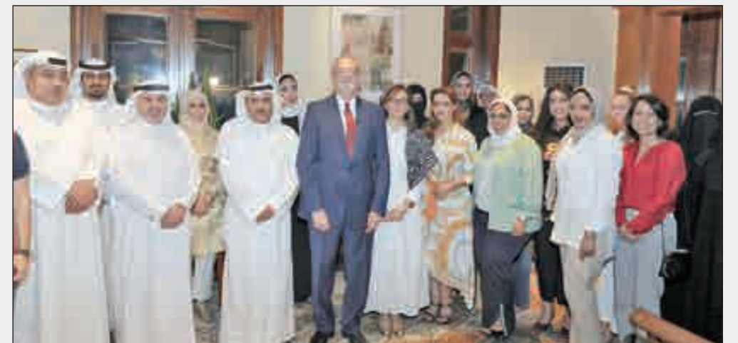
• السفير الأميركي وسعود الحربي يتوسطان الحضور في حفل الاستقبال

وذكر أن «تعلم اللغة الإنكليزية يعد جوهر كل الموضوعات الأخرى» معربا عن سعادته بالشراكة الناجحة والمستمرة على مدى ثلاث سنوات مع وزارة التربية الكويتية. وأضاف «نقدر الجهود الكويتية في توفير فرص النجاح للطلاب الكويتيين ونشارك سويا في هذا الهدف» مشيدا بحرص المعلمين والمعلمات على الاستفادة من الخبرات المشاركة في هذا البرنامج