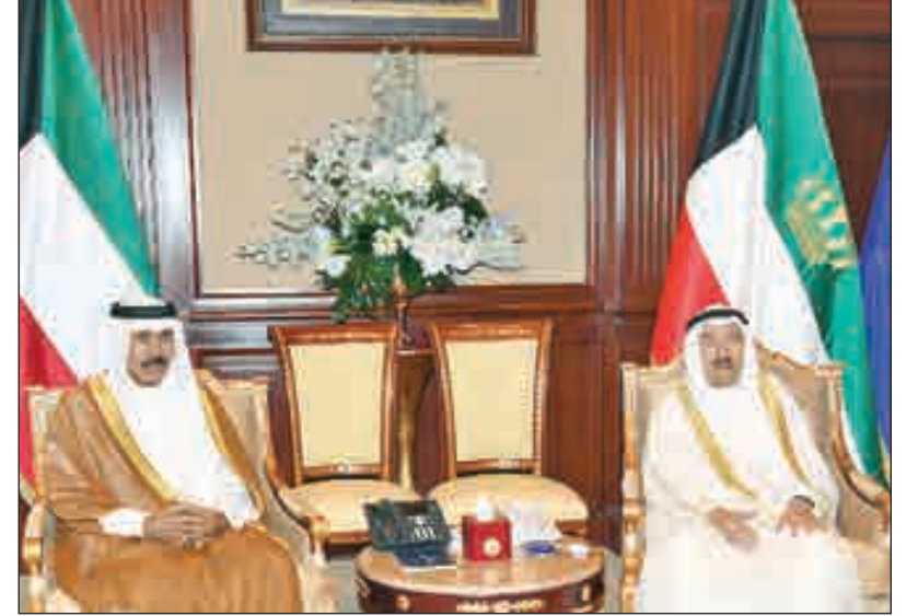
• صاحب السمو مستقبلا سمو ولي العهد

من إجراءات لمواجهة الإرهاب وحفظ أمنها ومجددا موقف الكويت الراض للإرهاب بكافة أشكاله وصوره سائلا سموه المولى تعالى أن يحفظ السعودية وشعبها الكريم من كل مكروه. كما بعث سمو ولي العهد الشيخ نواف الأحمد، وسمو الشيخ جابر المبارك، رئيس مجلس الوزراء، ببرقيات مماثلة.