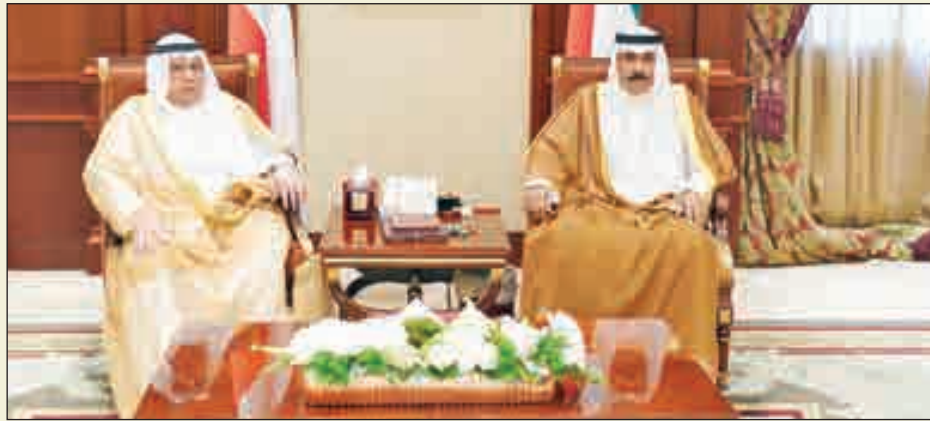
• سموه مستقبلا الشيخ خالد الجراح