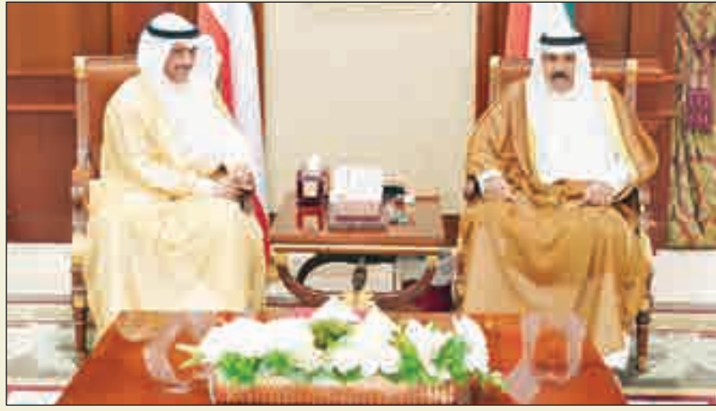
•... وخلال استقباله مرزوق الغانم

استقبل سمو ولي العهد الشيخ نواف الأحمد، بقصر بيان أمس، سمو الشيخ جابر المبارك رئيس مجلس الوزراء. كما استقبل سموه، رئيس مجلس الأمة مرزوق الغانم. واستقبل سموه، نائب رئيس مجلس الوزراء وزير الداخلية الشيخ خالد الجراح.