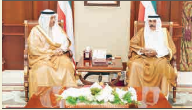
• سمو ولي العهد مستقبلا سمو الشيخ جابر المبارك