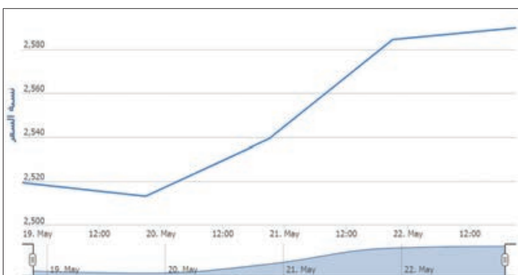
• مؤشر دبي

عكست مشيريات انتقائية على معظم الأسهم القيادية مسار سوق الأسهم دبي إلى الارتفاع وتحقيق مكاسب تربو إلى نحو 2 مليار درهم، في وقت منحت فيه الإمارة إقامات دائمة للمستثمرين والكفاءات الاستثنائية. وانخفض المؤشر العام للسوق بنسبة 0.56% في خمس جلسات، إلى مستوى 2589.68 نقطة ليربح خلالها نقطة مقارنة بمستوى السابق 2575.01 نقطة بنهاية الأسبوع السابق.