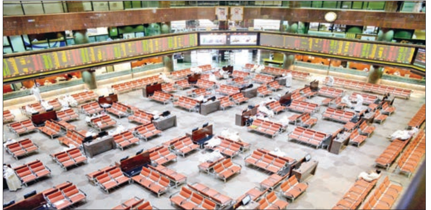
• هبوط عدد الصفقات بنسبة 32.3%

خلال الفترة القصيرة القادمة يحتاج المؤشر اختراق مستوى المقاومة 5635 نقطة مع ارتفاع السيولة وأحجام التداول؛ عندها يكون مستوى 5850 هدفاً قائماً مرواً بمناطق مقاومة عند المستويات 5685 و5805 نقطة على التوالي. وانخفضت أحجام التداول بالبورصة خلال الأسبوع، لتصل إلى 474.39 مليون سهم مقابل 615.35 مليون سهم في الأسبوع السابق، بتراجع 22.9%. كما تقلصت السيولة الأسبوعية للبورصة بنحو 32.3%، لتصل إلى 119.76 مليون دينار مقابل 176.77 مليون دينار في الأسبوع السابق مباشرة. وبالنسبة لصفقات الأسبوع، فشهدت انخفاضاً بنسبة 11.6%، لتصل إلى 24.08 ألف صفقة مقابل 27.25 ألف صفقة في الأسبوع السابق.