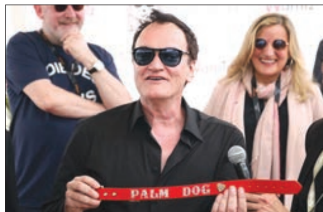
• المخرج تارانتينو يتسلم جائزة سعفة الكلب في مهرجان «كان»

بعد 25 عاماً من النجاح الكبير لفيلمه «بابل فيكتشن» في مهرجان كان، فاز الفيلم الجديد للمخرج الأميركي كوينتن تارانتينو بجائزة في المهرجان بفضل كلبة ظهرت في الفيلم.