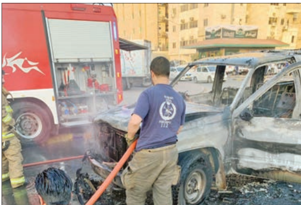
• المركبة بعد إخماد الحريق