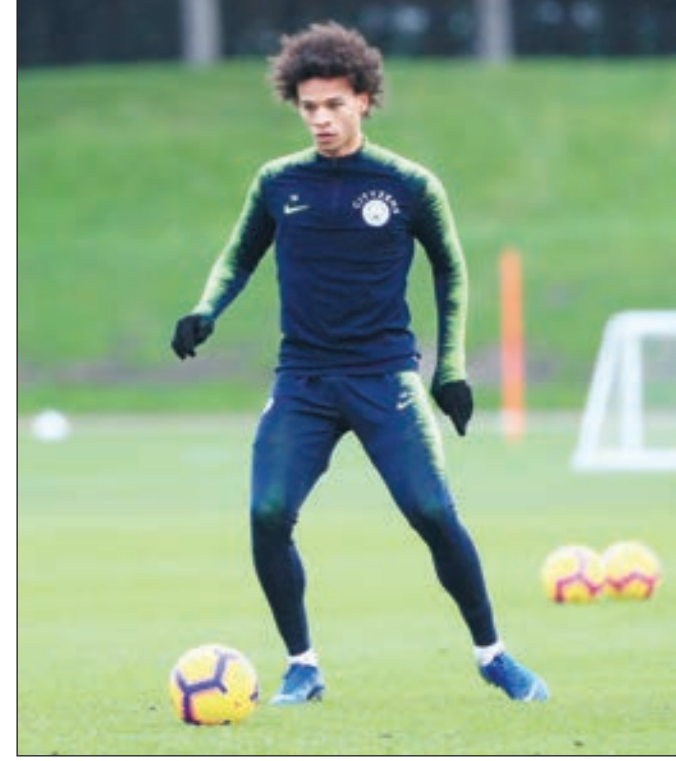
• ليروي سانيه

أكد أولي هونيس، رئيس نادي بايرن ميونخ بطل الدوري الألماني لكرة القدم في الموسم السبعة الأخيرة، الخميس اهتمام النادي البافاري بضم الجناح الدولي لوروا سانيه من مانشستر سيتي الإنكليزي.