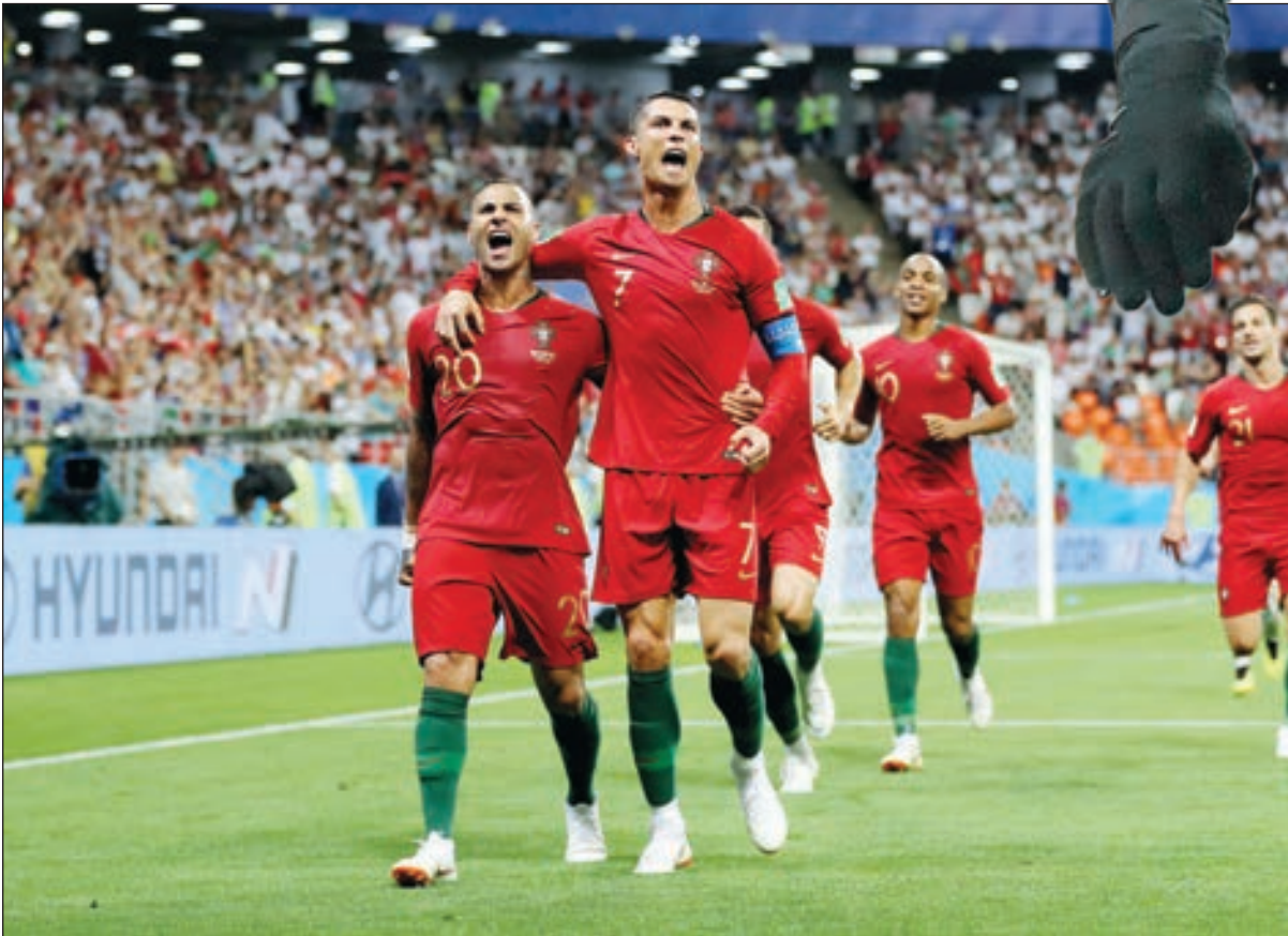
• رونالدو يعود لقيادة منتخب بلاده

أعلن فرناندو سانتوس مدرب منتخب البرتغال عن القائمة المستدعاة لمواجهة سويسرا في نصف نهائي دوري الأمم الأوروبية والتي عرفت تواجد نجم نادي يوفنتوس الإيطالي كريستيانو رونالدو. وسينضم كريستيانو رونالدو لمنتخب البرتغال في دوري الأمم الأوروبية لأول مرة بعدما اختار أخذ استراحة بعد كأس العالم بروسيا الصيف الماضي الذي شهد خروج فريقه من دور 16 ضد منتخب الأوروغواي. اختار فرناندو سانتوس المدير الفني للفريق عدم استدعاء المحاربين القدامى أندرياس سيلفا، وناسي، وريكاردو كواريسما، ومهاجم إشبيلية أندريه سيلفا، الذي يغيب عن الملاعب بسبب إصابة في الركبة.