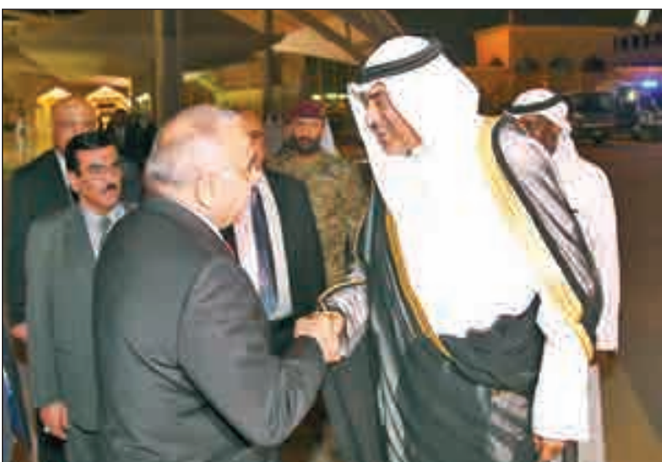
• الشيخ صباح الخالد مودعاً عادل عبدالمهدي

غادر رئيس مجلس الوزراء العراقي عادل عبدالمهدي والوفد المرافق البلاد مساء أمس الاول بعد زيارة رسمية قصيرة. وكان في وداعه على أرض مطار الكويت الدولي نائب رئيس مجلس الوزراء وزير الخارجية الشيخ صباح الخالد، ونائب رئيس مجلس الوزراء وزير الدولة لشؤون مجلس الوزراء رئيس بعثة الشرف المرافقة أنس الصالح، وعدد من الشيوخ والوزراء والمستشارين وكبار المسؤولين في الدولة وديوان رئيس مجلس الوزراء وسفيراً البلدين.