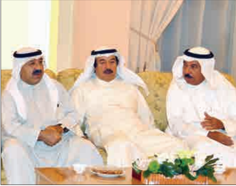
• النائب الأول ووزير الدفاع الشيخ ناصر الصباح خلال مأدبة الإفطار