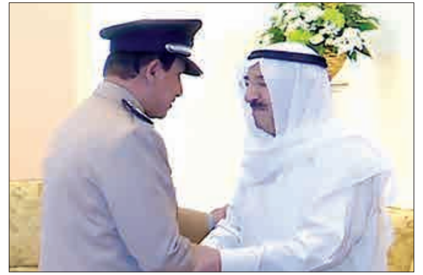
• سمو الأمير مصافحاً الفريق عصام النهام

استقبل صاحب السمو أمير البلاد الشيخ صباح الأحمد وسمو ولي العهد الشيخ نواف الأحمد بقصر دسمان مساء أمس نائب رئيس مجلس الوزراء وزير الداخلية الشيخ خالد الجراح ومستشار نائب رئيس مجلس الوزراء وزير الداخلية الفريق أول متقاعد سليمان الفهد ووكيل وزارة الداخلية الفريق عصام النهام وكبار القادة في وزارة الداخلية حيث أقيم سموه مأدبة إفطار على شرفهم. حضر اللقاء نائب رئيس الحرس الوطني الشيخ مشعل الأحمد.