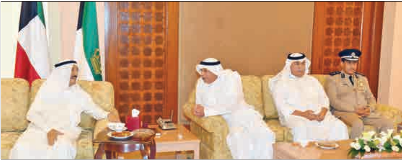
• سمو الأمير في حديث مع الشيخ خالد الجراح والفريق متقاعد سليمان الفهد والفريق عصام النهام

استقبل صاحب السمو أمير البلاد الشيخ صباح الأحمد وسمو ولي العهد الشيخ نواف الأحمد بقصر دسمان مساء أمس نائب رئيس مجلس الوزراء وزير الداخلية الشيخ خالد الجراح ومستشار نائب رئيس مجلس الوزراء وزير الداخلية الفريق أول متقاعد سليمان الفهد ووكيل وزارة الداخلية الفريق عصام النهام وكبار القادة في وزارة الداخلية حيث أقيم سموه مأدبة إفطار على شرفهم. حضر اللقاء نائب رئيس الحرس الوطني الشيخ مشعل الأحمد.