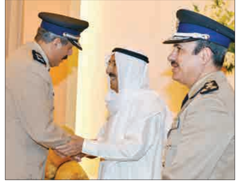
• صاحب السمو مصافحاً اللواء فيصل النواف

بعث سمو أمير البلاد الشيخ صباح الأحمد، ببرقية تعزية إلى السلطان عبد الله أحمد شاه ملك ماليزيا، عبر فيها سموه عن خالص تعازيه وصداق مواساته بوفاة المغفور له بإذن الله تعالى السلطان أحمد شاه المستعين بالله سائلاً سموه المولى تعالى أن يتغمده بواسع رحمته ويسكنه فسيح جناته وأن يلهم الأسرة الكريمة جميل الصبر وحسن العزاء. وبعث صاحب السمو، ببرقية تعزية إلى رئيس الصومال محمد عبدالله محمد «فرماجو»، أعرب فيها سموه عن خالص تعازيه وصداق مواساته بضحايا التفجير الذي وقع عند نقطة تفتيش أمنية في العاصمة مقديشو وأسفر عن سقوط عدد من الضحايا والمصابين راجياً سموه للضحايا الرحمة وللمصابين سرعة الشفاء والعافية مؤكداً سموه استنكار الكويت وإدانتها الشديدة لهذا العمل الشنيع الذي استهدف أرواح الأبرياء الأمنيين والمنافى لكافة الشرائع والقيم الإنسانية. وبعث سمو ولي العهد الشيخ نواف الأحمد، وسمو الشيخ جابر المبارك، رئيس مجلس الوزراء ببرقية تعزية مماثلة.