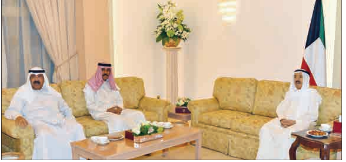
• سمو الأمير وسمو ولي العهد والشيخ مشعل الأحمد

بحضور ولي العهد والشيخ مشعل الأحمد والنائب الأول