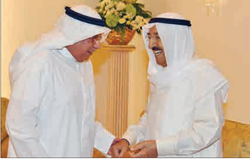
• صاحب السمو مرحباً بوزير الداخلية الشيخ خالد الجراح