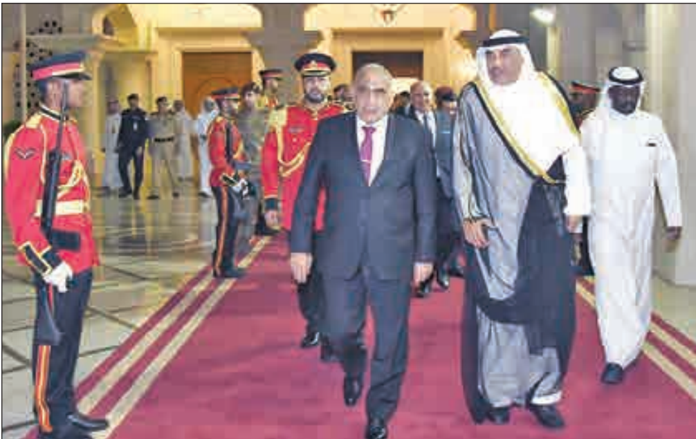
• رئيس الوزراء العراقي مغادراً البلاد