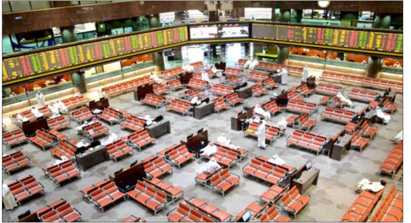
• السوق الأول حقق مكاسب بنحو 0.04%

وتصدر سهم قيوين القائمة والخضراء بـ 20.78% فيما جاء رملا الكويت على رأس التراجعات بـ 19.94% وحصول أنشيط التداولات. تصدر بيك المنخفض بـ 6.02 ملايين سهم، فيما جاء الوطني على رأس السيولة بقيمة 4.38 ملايين دينار، مرتفعا 1.16%.