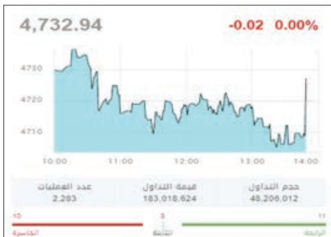
• مؤشر أبوظبي

وتصدر قطاع العقارات الخسائر بنهاية التعاملات، بتراجع نسبته 0.56%، ليهبط سهم أرابيك القابضة بنسبة 2.08% إلى مستوى الـ 1.41 درهم، وإعمار للتطوير وإعمار مولز وإعمار العقارية بنسبة 1.89%، و1.14%، و0.5% على الترتيب. وجاء قطاع الخدمات متراجعا بنسبة 0.41%، في ظل تراجع سهم أمارات القابضة 1%، إضافة إلى هبوط القطاع البنكي بـ 0.25% مع تراجع سهم دبي التجاري ودبي الإسلامي بنسبة 0.85% و0.2% لكل منها على التوالي.