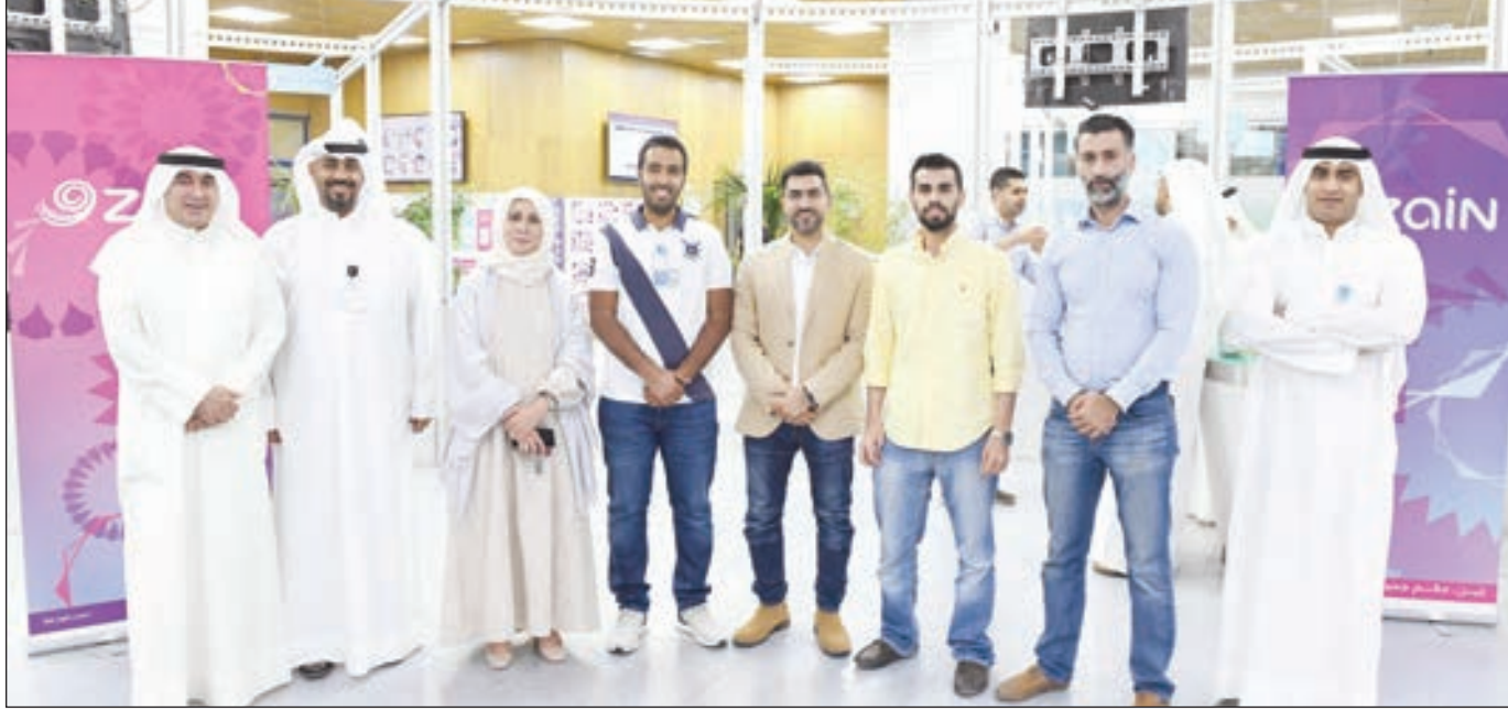
• مسؤولو «زين»