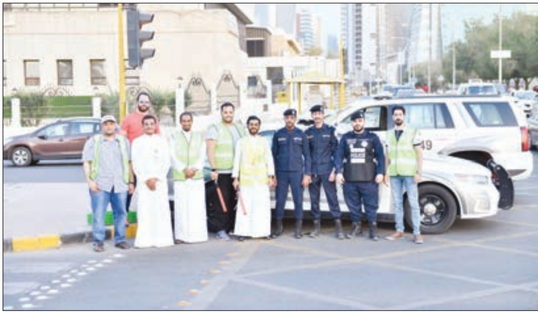
• فريق «بيتك» التطوعي