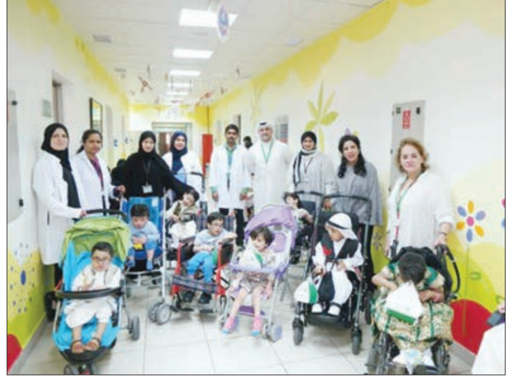
• «التجاري» شارك الأطفال فرحتهم بالقرقيعان