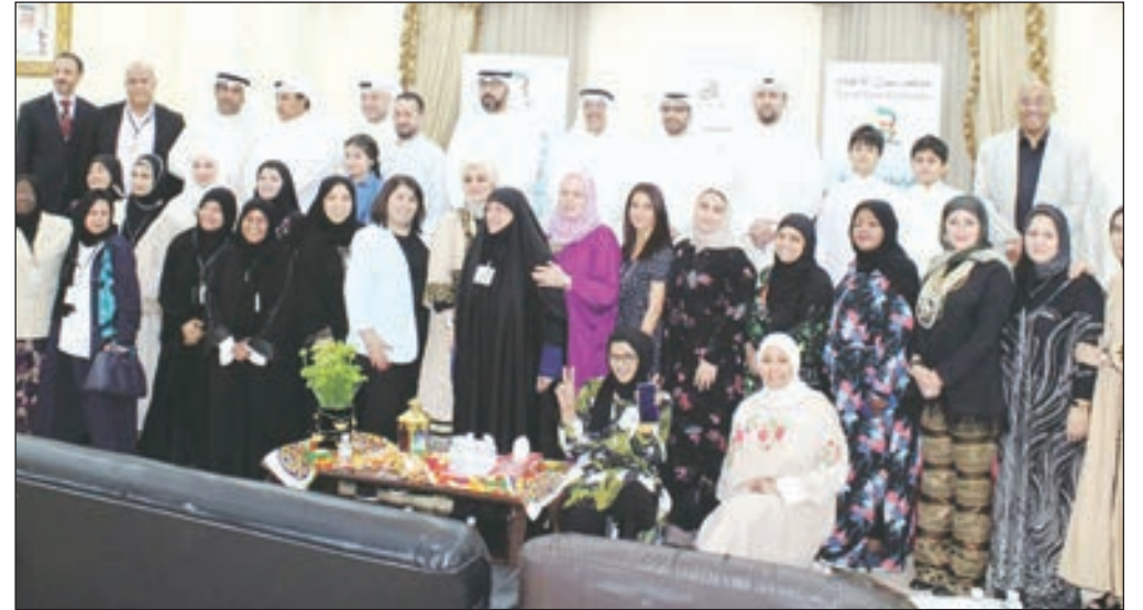
• الحضور خلال الغبة