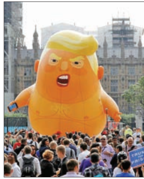
• بالون على شكل ترامب الرضيع الغاضب في لندن

واستقبال البالون ترامب عندما زار بريطانيا في عام 2018، فيما وصفه بأنه محاولة لجعله يشعر بعدم الترحيب.