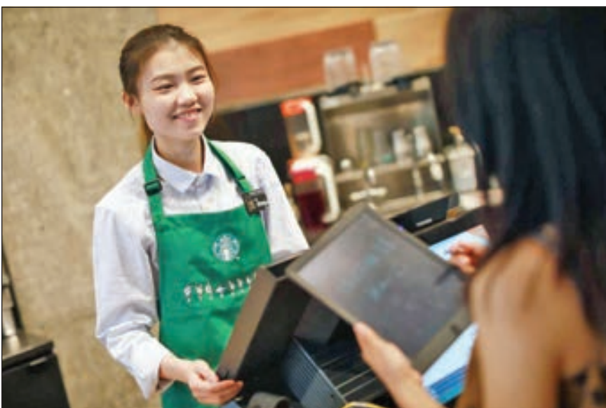
• موظفة في المتجر خلال تعاملها مع أحد الزبائن

افتتحت سلسلة مقاهي «ستاريكس» الأميركية أول متجر صامت في الصين؛ حيث جميع التعاملات في المتجر تتم عن طريق الإيماءات. وحسب ما ذكرته شبكة أخبار «شين لانغ» الصينية، فإن العملاء الذين يعانون من ضعف السمع يمكنهم طلب القهوة بطريقة أسهل في فرع ستاريكس بحي يوكسيو بمدينة قوانجتشو الجنوبية.