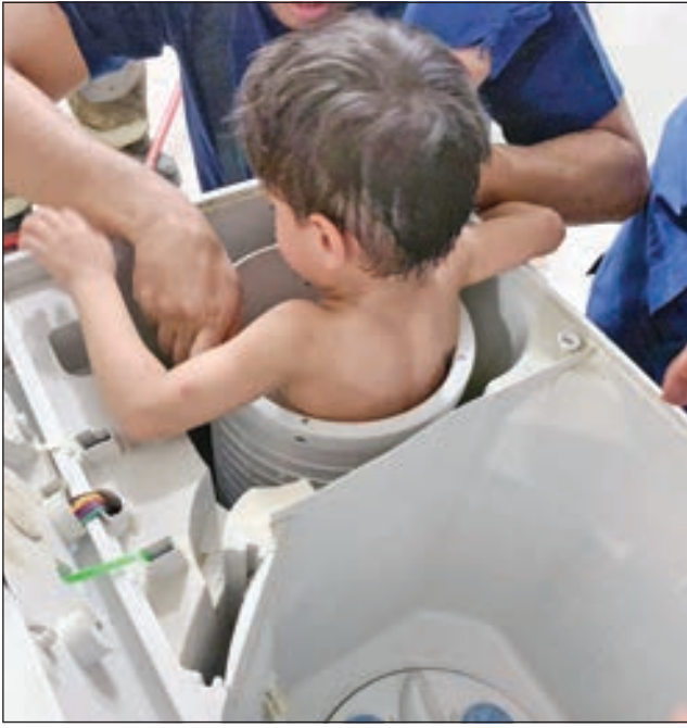
• لحظة إخراج الطفل من الغسالة