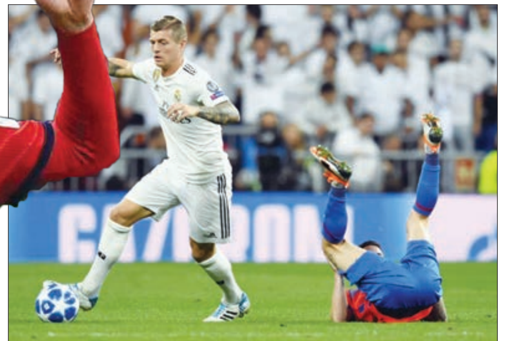
• كروس يمر بمهارة عالية

أعلن نادي ريال مدريد الإسباني، صباح، تجديد عقد الألماني توني كروس، لاعب وسط الفريق. وتذكر ريال مدريد عبر موقعه الرسمي على الإنترنت، أن النادي اتفق مع توني كروس، على تجديد عقده، ليظل بقميص النادي الملكي حتى 30 يونيو من عام 2023.