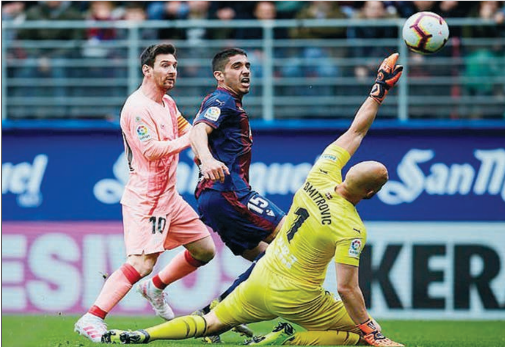
• ميسي نجح في تسجيل هدفين

اختتم برشلونة بطل الدوري الإسباني هذا الموسم مشواره في المسابقة بتعادل خارج ملعبه أمام إيبار بنتيجة «2-2»، ضمن منافسات الجولة 38 من المسابقة.