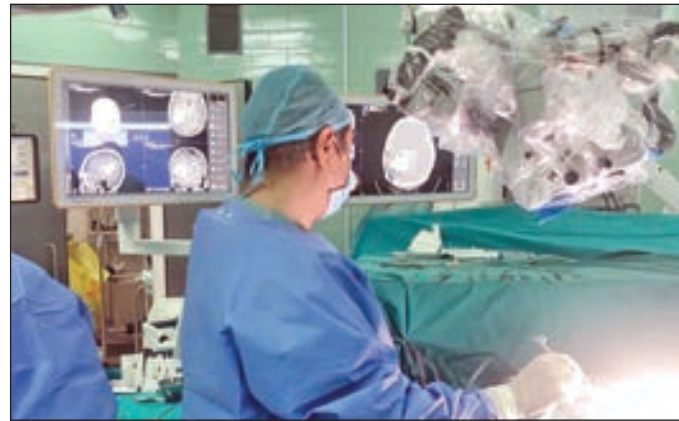
• إثناء إجراء الجراحة

فتحت الجمجمة بدائرة قطرها خمسة سنتيمترات موضحة أنه تم الوصول إلى الورم بشكل مباشر بعيداً عن المراكز الدماغية المهمة ومن دون إلحاق أي ضرر بها. وأضاف الشيخ الذي يشغل أيضاً رئيس قسم جراحة المخ والأعصاب في مستشفى ابن سينا أن إجراء هذه العملية «الحرجة والدقيقة» استغرق نحو ثلاث ساعات باستخدام جهاز «الملاح الجراحي - كيرف» للوصول بدقة عالية مكان وحجم الورم