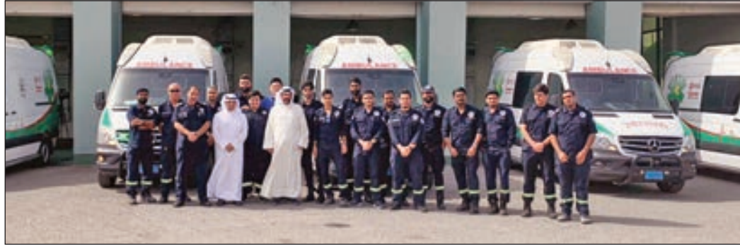
• إثناء تدشين سيارات الإسعاف الجديدة

الطوارئ في مستشفى العدان. وتهدف الخطوة إلى مواكبة التطور العالمي في مجال الإسعاف وفق مواصفات طبية وصحية عالمية لنجاحية السعة والارتفاع الذي لا يعوق تحرك فني الطوارئ داخل الإسعاف.