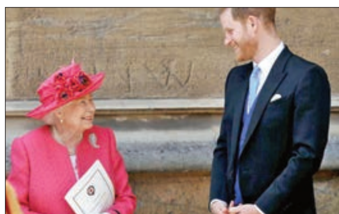
• الملكة إليزابيث والأمير هاري

ووضعت ميغان أول مولود لها هي وهاري في السادس من مايو الحالي، وسماه آرثني هاريسون ماونتباتن وندسور، وبوصوله أصبحت غابريلا في الترتيب الثاني والخمسين في ولاية العرش.