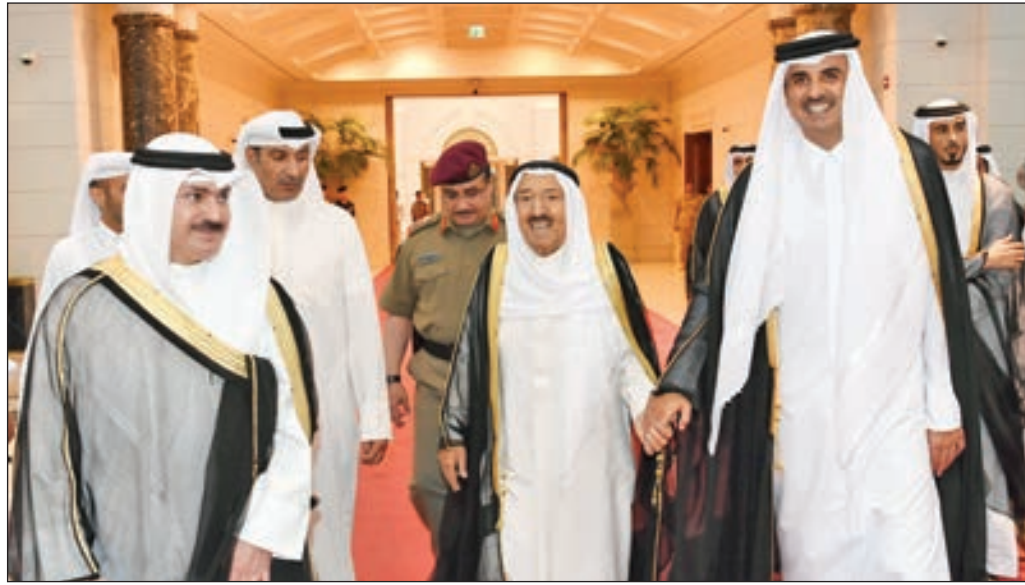
• سموه أثناء استقباله لأمير قطر