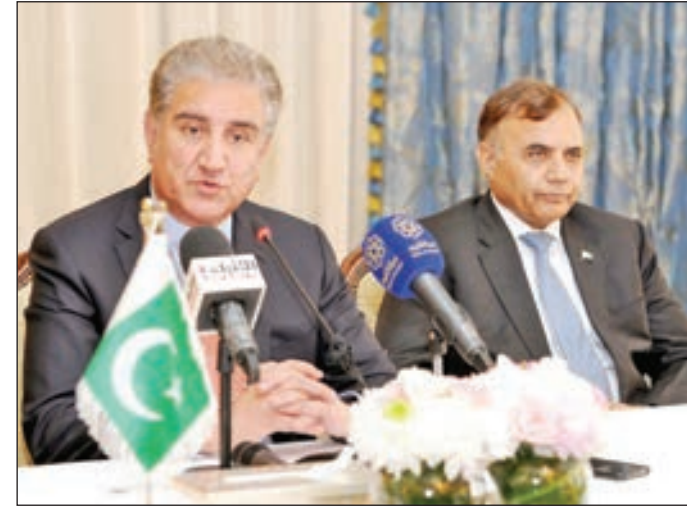
• شاه قريشي خلال المؤتمر الصحفي

واستطرد الوزير قريشي قائلاً: «نحن لا نتمنى الحرب فهذه المنطقة شهدت الكثير من الحروب والمآسي»، لافتاً إلى أن بلاده ستؤدي دوراً في نزع فتيل الأزمة». وكشف وزير خارجية باكستان عن زيارة مرتقبة لوزير الداخلية الباكستاني إلى الكويت بعد شهر رمضان المبارك.