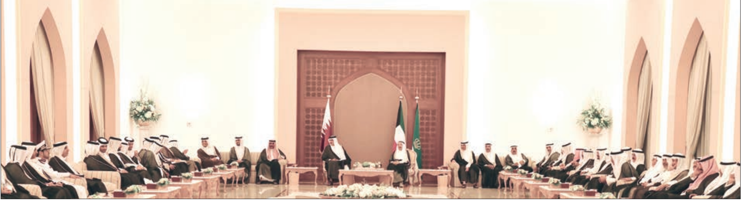
• سمو أمير البلاد خلال لقائه مع أمير قطر بحضور سمو ولي العهد وعدد من الشيوخ والمسؤولين

سموه أقام له مأدبة إفطار بمناسبة زيارته للبلاد