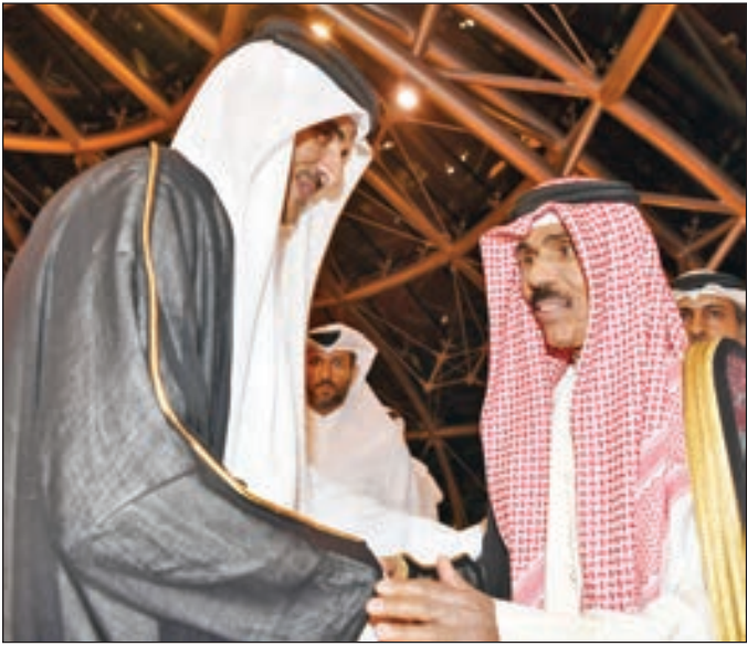
• سمو ولي العهد مودعاً سمو الشيخ تميم بن حمد

استقبل سمو أمير البلاد الشيخ صباح الأحمد بقصر دسمان عصر أمس سمو الشيخ تميم بن حمد أمير قطر والوفد المرافق لسموه وذلك بحضور سمو ولي العهد الشيخ نواف الأحمد حيث قدم لسموه التهاني بمناسبة شهر رمضان المبارك على الجميع بالخير واليمن والبركات. هذا وقد تم خلال اللقاء تبادل الأحاديث