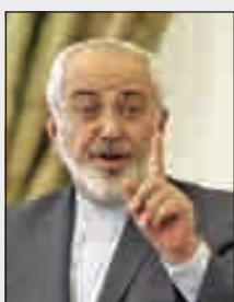
• محمد ظريف

قال وزير الخارجية الإيرانية، محمد ظريف، «لن تكون هناك حرب في المنطقة»، مؤكداً أنه لا يمكن لأي دولة في المنطقة أن تواجه إيران. وأضاف في تصريح من بكين، إن الرئيس ترامب، لا يسعى إلى الحرب، لكن في إدارته هناك من يريدون دفعه إلى الحرب. ولفت إلى أن إسرائيل ودولا في المنطقة تسعى لفرض سياساتها على الإدارة الأميركية عبر المال.