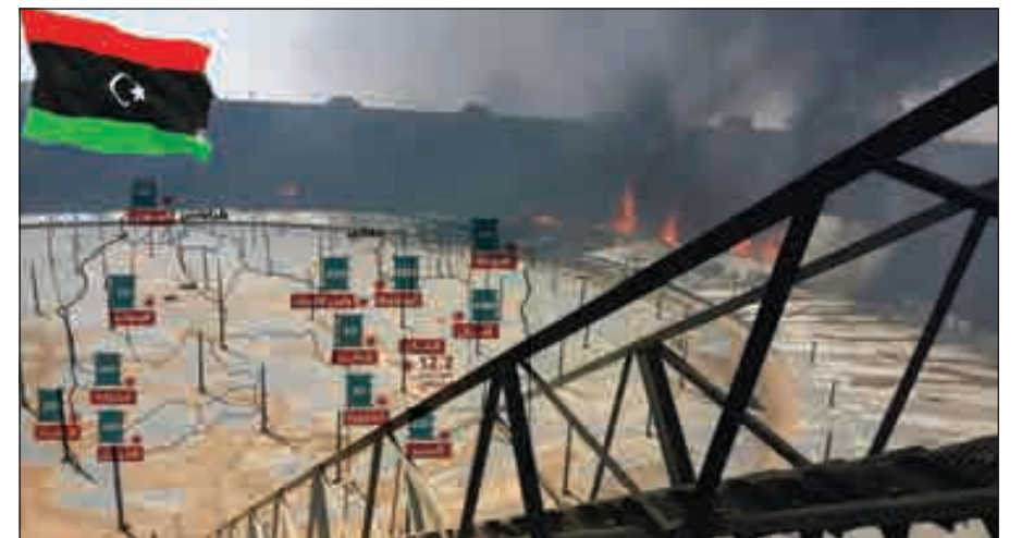
• مواقع النفط المهتدة بفقدان إنتاجها في ليبيا

حذر رئيس المؤسسة الوطنية للنفط في ليبيا، مصطفى صنع الله، من أن بلاده قد تخسر 95% من إنتاجها النفطي إذا استمرت حالة عدم الاستقرار في ليبيا. وفي تصريح صحافي أدلى به في جدة، قبيل اجتماع لجنة المراقبة الوزارية المشتركة، لمنتهجي النفط من «أوبك» وخارجها، قال صنع الله: «للأسف، إذا استمر الوضع على هذا المنوال فأخشى أننا قد نفقد 95% من الإنتاج»، مشيرا إلى أن الإنتاج الحالي يبلغ نحو 1.3 مليون برميل في اليوم. واندلعت اشتباكات عنيفة بين قوات شرق ليبيا الموالية للجيش الليبي وحفر قوات حكومة الوفاق الليبية بهدف السيطرة على طريق المطار ومنطقة «صالح الدين» بالعاصمة طرابلس. وذكرت «قناة 218 الليبية» في تقرير أن هذه الاشتباكات العنيفة تأتي بعد ساعات فقط من اندلاع اشتباكات عنيفة بمحور «عين زارة» بالأسلحة الثقيلة والصواريخ، أسفرت عن سقوط عدد من الضحايا.