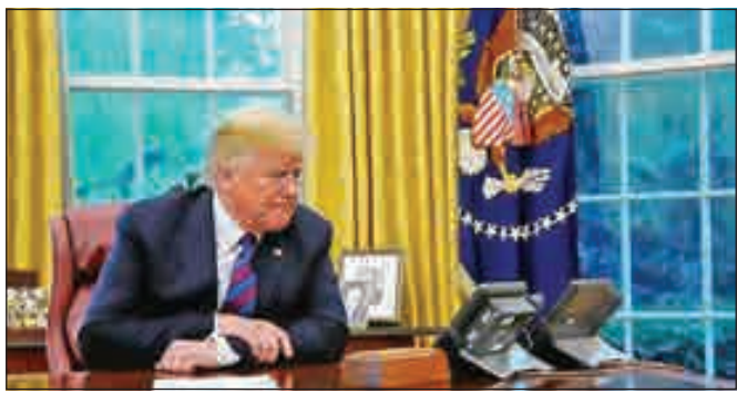
• دونالد ترامب في انتظار اتصال من إيران

أكد مسؤول في إدارة الرئيس الأمريكي، دونالد ترامب، أن قادة الولايات المتحدة في انتظار اتصال هاتفي من سلطات إيران لتخفيف التوتر الحالي، لكن طهران لم تبد بعد أي رغبة في التواصل. وذكر المسؤول «رفع المستوى»، أن الرئيس ترامب منفتح لبدء الحوار مع القيادة الإيرانية، قائلا: «نجلس أمام الهاتف»، إلا أنه لم ترد بعد أي مؤشرات على أن طهران تستجيب لدعوة البيت الأبيض للتواصل.