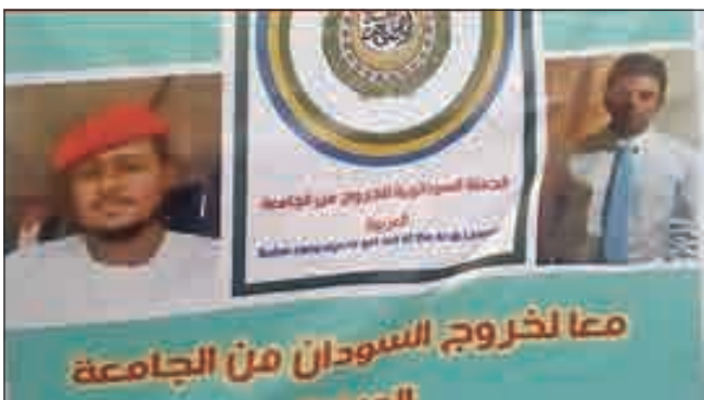
• الترويج لخروج السودان من الجامعة العربية

أطلق نشطاء سودانيون دعوات عدة للخروج من الجامعة العربية منذ عام 2016، لكن تلك الدعوات لم تجد طريقها خارج مواقع التواصل الاجتماعي إلا بعد رحيل البشير وحكومته. وخلال فترة قصيرة، تحولت الحملة التي لم تدشن رسمياً حتى الآن إلى مطلب لبعض المعتصمين، وتخطى عدد أعضاء الحملة حتى الآن حاجز الـ 36 ألف توقيع. ويرى القائلون على الحملة أن السودان بلد أفريقي تعرض للفرقة العنصرية، وأن اللغة العربية ثقافة وليست عرقاً بشرياً، مؤكداً أن التدشين الرسمي للحملة سيكون نهاية الأسبوع الحالي.