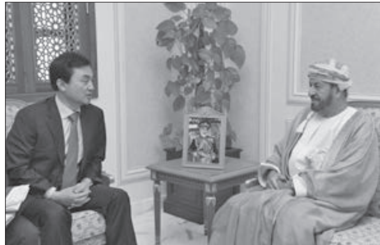
• البوسعيدي مستقبلاً أمن جيو باك

ونظراً لأن معهد المهندسين المدنيين يعترف رسمياً الآن بشهادات الهندسة المدنية المعتمدة من قبل مجلس الاعتماد للهندسة والتكنولوجيا الأمريكي، فستكون هناك العديد من المزايا لخريجي وطلبة الهندسة المدنية بجامعة السلطان قابوس، فالطلبة الذين يتخرجون من برامج «ABET» المعتمدة لن يكونوا بحاجة إلى طلب التقدم للحصول على التقييم الأكاديمي للحصول على مؤهل المهندسين المدنيين. ويشجع المعهد أعضاءه لمواصلة تطورهم المهني عن طريق توفير مجموعة من الموارد المعرفية مثل الدورات التدريبية والمنشورات، ويتمتع كذلك أعضاء المعهد بالعديد من المزايا مثل فرص التطوير الوظيفي ورفع المستوى المهني والوصول إلى شبكة واسعة من المهنيين وموارد المعرفة وغيرها.