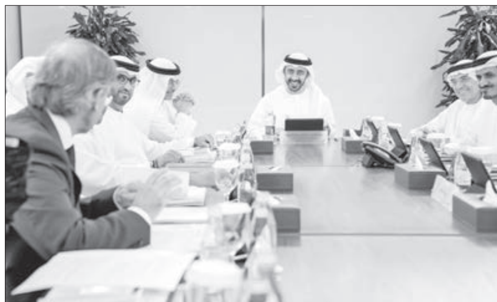
• الشيخ عبدالله بن زايد خلال الاجتماع

في التجربة التعليمية الشاملة التي توفرها لإعداد دبلوماسيي الإمارات المستقبلين حيث تستخدم الأكاديمية أساليب تعليمية حديثة تجمع ما بين المحاضرات وجلسات الحوار التفاعلية مع دبلوماسيين وصناع سياسات عالميين بالإضافة إلى تقديم دراسات تحليلية عالمية وعد من المواضيع الدبلوماسية العامة والمتخصصة المتعلقة بدبلوماسية القرن الـ21 وقضايا التنمية المستدامة وتغير المناخ والاستخدام السلمي للطاقة النووية والطاقة المتجددة وقضايا السلم والأمن على صعيد المنطقة والعالم.