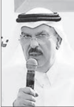
• محمد العمادي

لتخفيف معاناته الإنسانية على طريق إنهاء الحصار وليس مقابل أي شيء آخر». وأشار إلى أن «ما تقوم به قطر إنما هو من أجل حقن وحماية الدم الفلسطيني، ونرفض أي عدوان يتعرض له الشعب الفلسطيني، وهذا ما نؤكد في كل المحافل الدولية». وشدد البيان على «احترام قرار الفصائل الفلسطينية، وأثق أنها تعمل وفق تقديراتها للواقع لما فيه الصالح، سواء أكان ذلك في ميدان السياسة أو المقاومة أو التوصل للتفاهات الأخيرة نحو تثبيت التهدة في إطار قرار فلسطيني موحد يعكس وحدتها الميدانية وأهدافها المرهبة». واختتم البيان بالقول: «أدعو الأخوة الذين تسرعوا في التاويل إلى التريث وعدم الاستعجال في تفسير الأمور لأن ما بيننا عبر مسيرة الإعمار والبناء وتخفيف الحصار هو أكبر من احتزاله في تصريح لم أقصد فيه الإساءة لأحد». وغادر السفير محمد العمادي قطاع غزة فجر أمس عبر حاجز بيت حانون برفقة نائبه خالد الحردان بعد وصوله الاثنين الماضي.