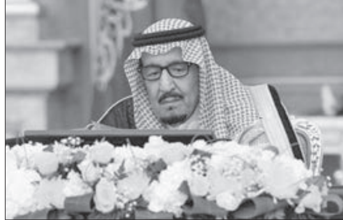
• الملك سلمان مترشحا لاجتماع مجلس الوزراء

ويرى خبراء اقتصاد أن تطبيق نظام «الإقامة المميزة» سيخفض تحويلات الأجانب إلى الخارج، وسيوفر 10 مليارات دولار سنوياً على الاقتصاد.