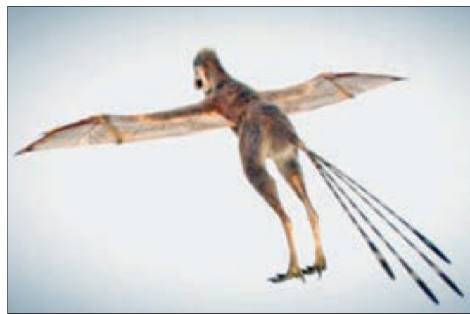
• علماء رسما صورة تخيلية لشكل الديناصور

ولهذا، يقدم Ambopteryx longibrachium دعماً كبيراً لمفهوم «التطور الموازي» هو بسبب تعرضها لنفس الضغط تطور سمة معينة واحدة في أنواع الطوري».