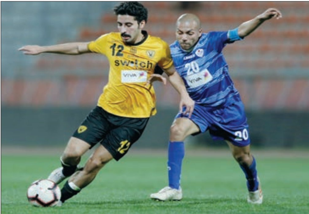
• جانب من لقاء سابق للشباب أمام القادسية