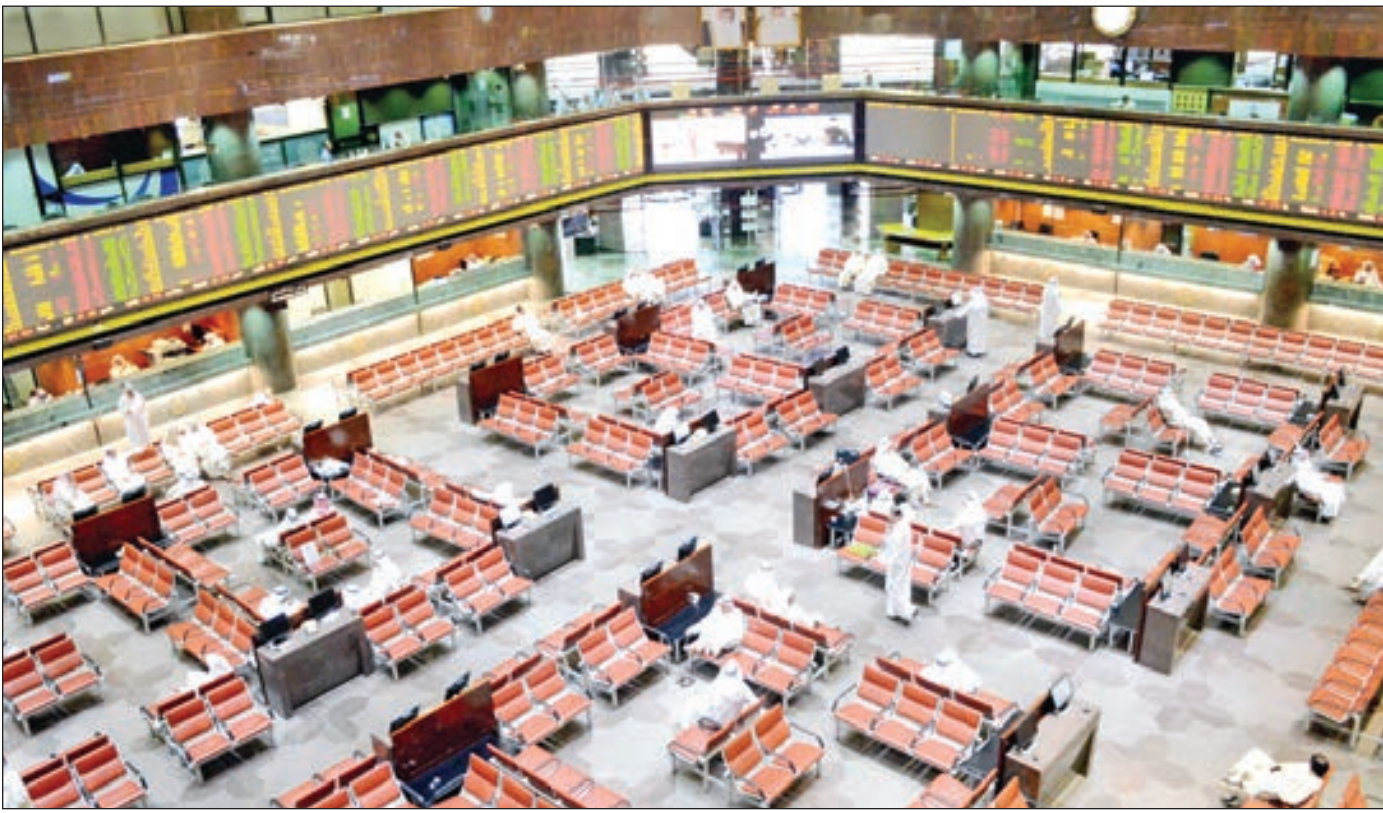
• مؤشر السوق الأول انخفض 0.19%

هبعت المؤشرات الكويتية جماعياً للأسبوع الثاني على التوالي، حيث تراجع المؤشر العام 0.19% عند 5705.61 نقطة مقابل 5705.61 نقطة للأسبوع السابق، خاسراً 10.65 نقطة. كما تراجع مؤشر السوق الأول 0.19% بإقفاله عند النقطة 6125.81، مقارنة بإقفاله الأسبوع السابق عند النقطة 6137.36. بخسائر بلغت 11.55 نقطة. وتراجع مؤشر السوق الرئيسي خلال الأسبوع بنحو 0.18% وصولاً إلى النقطة 4866.32 خاسراً 8.9 نقطة، مقارنة بإقفال الأسبوع السابق عند 4875.22 نقطة. وانخفضت أحجام التداول بالبورصة خلال الأسبوع، لتصل إلى 424.86 مليون سهم مقابل 424.86 مليون سهم في الأسبوع السابق، بتراجع 45.2%. كما تقلصت السيولة الأسبوعية للبورصة بنحو 26.7%، لتصل إلى 90.73 مليون دينار مقابل 123.79 مليون دينار في الأسبوع السابق مباشرة. وبالنسبة لصفقات الأسبوع، فشهدت تراجعاً بنسبة 19.2% لتصل إلى 24.43 ألف صفقة مقابل