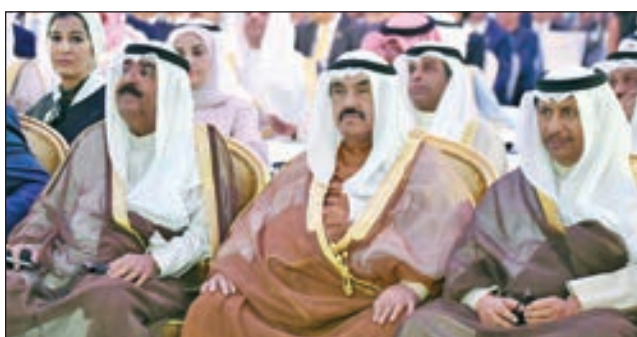
• سمو الشيخ ناصر المحمد متوسطاً الشيخ مشعل الأحمد وسمو الشيخ جابر المبارك