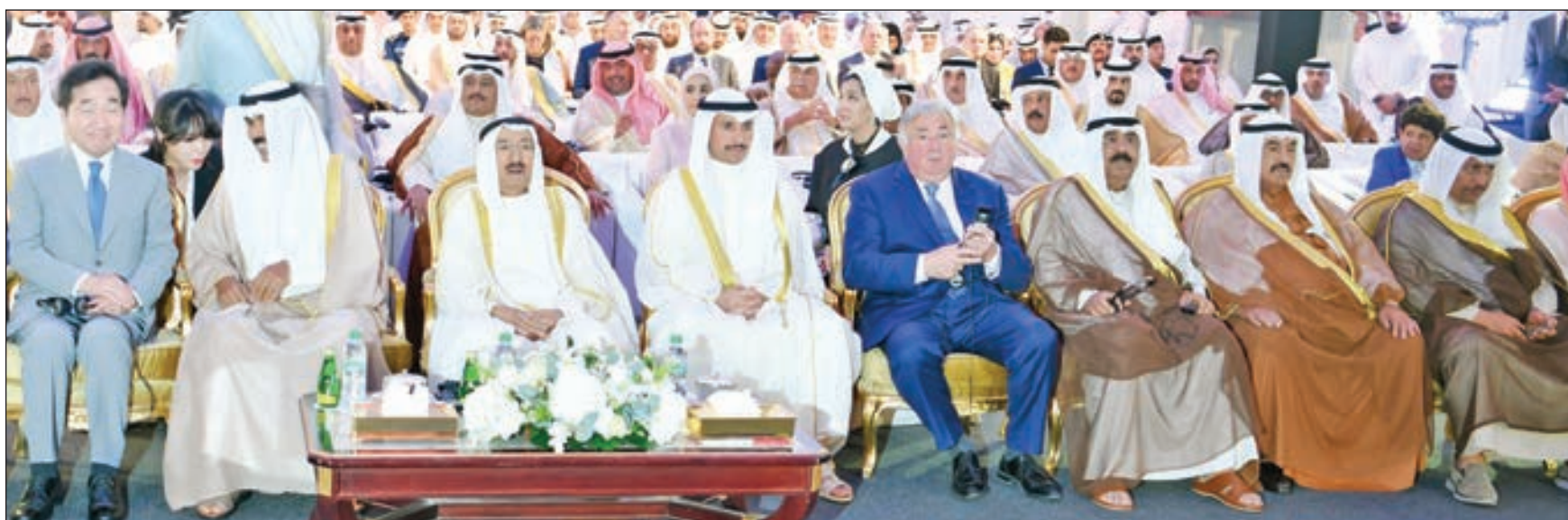
• صاحب السمو متوسطاً الحضور

وقد غادر سموه مكان الحفل بممثل ما استقبل به من حفاوة وتقدير.