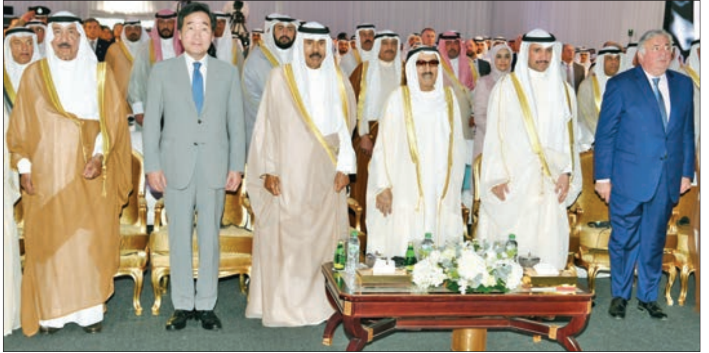
• سمو الأمير وسمو ولي العهد خلال عزف السلام الوطني

سموه أزاح الستار عن المشروع بحضور سمو ولي العهد وكبار المسؤولين بالدولة