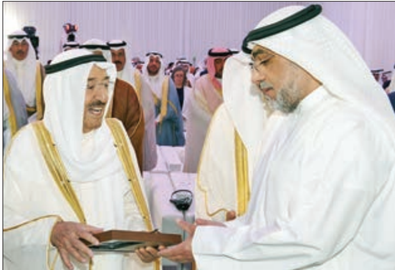
• سمو الأمير مكرماً والد أحد شهداء المشروع

وتابع: «إنه لمن نوعي سروري أن تشارك الشركات الكورية في أكبر مشروع وطني في تاريخ الكويت وأتقدم بالشكر الجزيل لمن بذل قصارى جهده وطاقته من شركة هيونداي وشركة جيبيز للهندسة والمنشآت وغيرها على الاستمرار