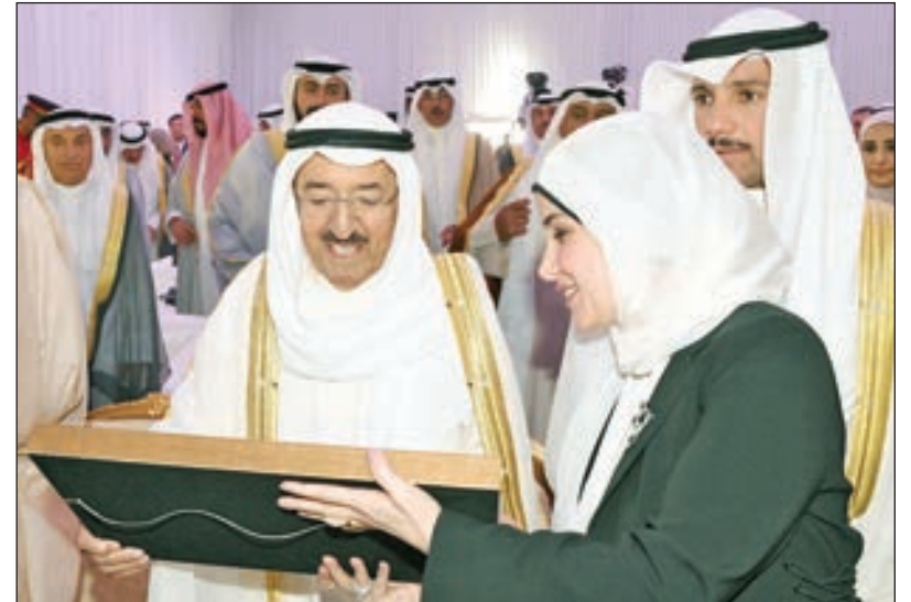
• سمو الأمير يتلقى هدية تذكارية من وزيرة الأشغال