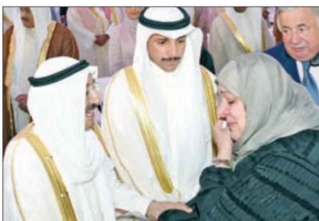
• سموه مستقبلاً إحدى ذوي الشهداء