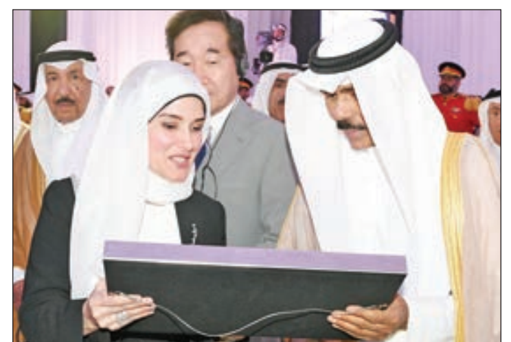
• هدية تذكارية لسمو ولي العهد