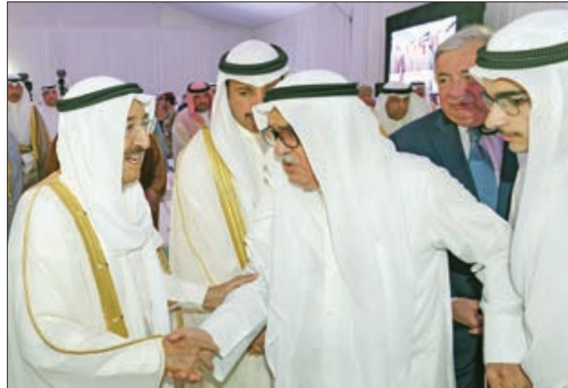
• صاحب السمو لدى استقباله ذوي شهداء الواجب