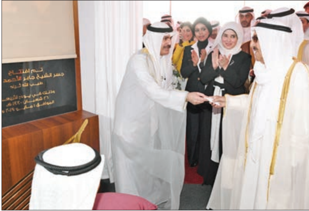
• صاحب السمو يعطي إشارة البدء لافتتاح جسر الشيخ جابر الأحمد