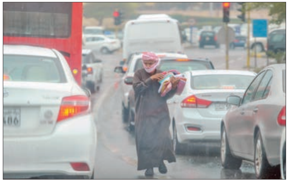
• ظاهرة الباعة الجائلين في شوارع الكويت

تعد ظاهرة انتشار الباعة الجائلين عند تقاطعات الطرق الرئيسية والفرعية والساحات العامة وبجانب الاسواق من الظواهر السلبية في المجتمع وتؤدي الى تبعات سيئة صحيا واقتصاديا واجتماعيا. وغالبا ما تكون المواد الغذائية التي بحوزة هؤلاء الباعة غير مستوفاة لاشتراطات الصحية وتشكل