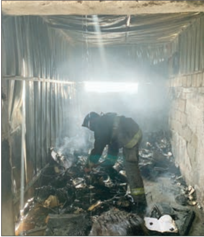
• رجل إطفاء في موقع الحريق