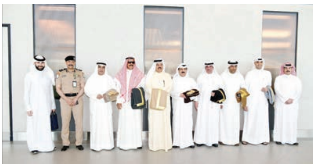
• الشيخ فيصل النواف والوفد المرافق له

وأسفرت عن سقوط المئات من الضحايا والمصابين مؤكداً سموه استنكار الكويت لهذه الأعمال الإجرامية والتي تتنافى مع كافة الشرائع السماوية والمواثيق الدولية والقيم الإنسانية راجياً سموه للضحايا الرحمة وللصابين سرعة الشفاء وبعث صاحب السمو، ببرقية تهنئة إلى فلاديمير زيلينسكي الرئيس المنتخب لأوكرانيا، عبر فيها سموه عن خالص تهنئته بمناسبة فوزه في الانتخابات الرئاسية رئيساً لأوكرانيا متمنياً سموه له موفور الصحة والعافية وكل التوفيق والسداد وللعلاقات الطيبة بين الكويت وأوكرانيا المزيد من التطور والنماء. وبعث سمو ولي العهد الشيخ نواف الأحمد، وسمو الشيخ جابر المبارك رئيس مجلس الوزراء ببرقيات مماثلة.