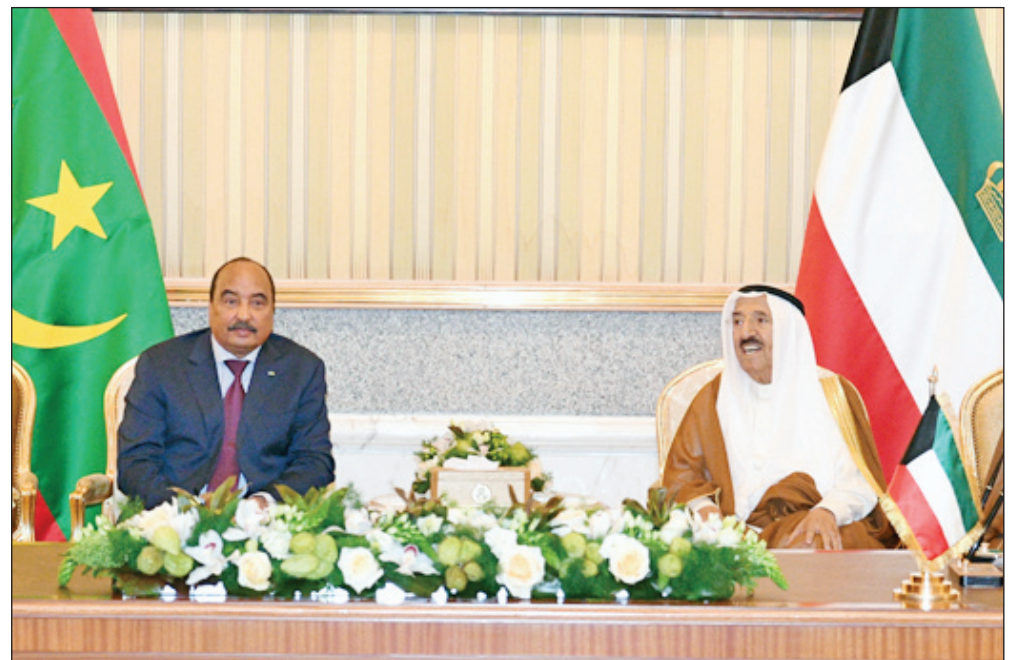
• سمو الأمير ورئيس موريتانيا خلال توقيع الاتفاقيات

حضور صاحب السمو أمير البلاد الشيخ صباح الأحمد، والرئيس الموريتاني محمد ولد عبدالعزيز، ورئيس مجلس الوزراء بالإنابة وزير الدفاع الشيخ ناصر الصباح، تم بقصر بيان أمس، التوقيع على اتفاقيات بين الكويت وموريتانيا وهي كما يلي: أولاً: اتفاقية التعاون الإعلامي بين حكومة الكويت وحكومة موريتانيا، وقعتها عن حكومة الكويت نائب رئيس مجلس الوزراء وزير الخارجية الشيخ صباح الخالد، وعن حكومة موريتانيا وزير الشؤون الخارجية والتعاون إسماعيل ولد الشيخ أحمد. ثانياً: اتفاقية التعاون في مجال الثقافة والفنون بين حكومة الكويت وحكومة موريتانيا وقعتها عن حكومة