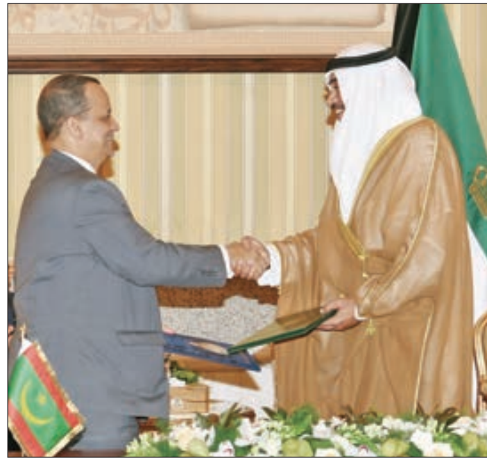
• الشيخ صباح الخالد وإسماعيل ولد الشيخ أحمد عقب توقيع الاتفاقية

تسلم صاحب السمو أمير البلاد الشيخ صباح الأحمد، بقصر بيان أمس، رسالة خطية من الرئيس التونسي الباجي قايد السبسي، تتعلق بالعلاقات الأخوية الطيبة التي تجمع البلدين والشعبين، وسبل تنميتها وتطويرها، كما تضمنت دعوة سموه لزيارة