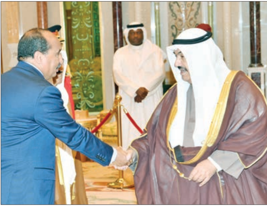
• سمو الشيخ ناصر المحمد مضافاً الرئيس الموريتاني

بالإنابة وزير الدفاع الشيخ ناصر الصباح، وكبار المسؤولين بالدولة. وتشكلت بعثة الشرف المرافقة للضيف من الديوان الأميري برئاسة المستشار بالديوان الأميري محمد ضيف الله شرار. ويرافق الرئيس الموريتاني وفد رسمي يضم كلا من وزير الخارجية والتعاون الدولي إسماعيل ولد الشيخ أحمد ووزير الاقتصاد والمالية المختار اجاي ووزير البيئة والتنمية المستدامة امدي كمرأ وعدد من كبار المسؤولين في حكومة موريتانيا.