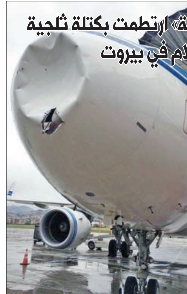
آثار ارتطام الكتلة الثلجية بطائرة الخطوط الكويتية

أعلنت الخطوط الجوية الكويتية، أمس، هبوط إحدى طائراتها «بسلام» وبشكل طبيعي في مطار رفيق الحريري الدولي في بيروت بعد تعرضها لارتطام مفاجئ بكتلة ثلجية عابرة.