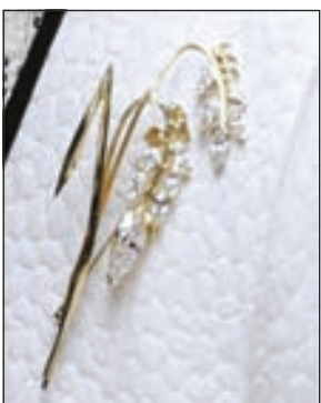
• البروش المرصع

كشف خبير الألماس والأحجار الكريمة جرات موبلي، عن هدية الملكة إليزابيث، قائلاً: إنها ستكون الأكثر تميزاً، متوقفاً أن تقدم بروشاً مرصعاً بالألماس تألفت به خلال مناسبات رسمية عدة للحفيد الملكي، وهو بروش «زهرة بوتسوانا» Botswana Flower، والذي منحه رئيس بوتسوانا الملكة إليزابيث عام 2007، ويضم 11 ماسة مثبتة على قطعة من الذهب الأصفر.