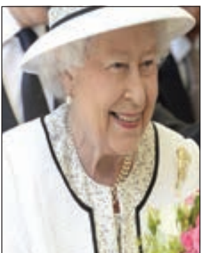
• الملكة إليزابيث