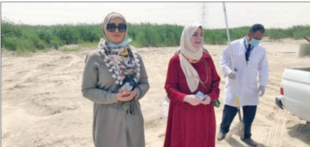
القطن والبطيخ خلال جولة في منطقة صباح الأحمد السكنية