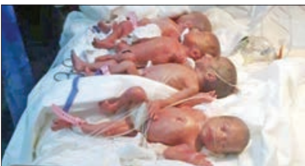
• المواليد في المستشفى النيجيري

صعوبة في الحمل التقاوي، الإجراءات الخاصة بالتكنولوجيا ونصحها الأطباء بأن تسعى الإنجابية في مساعدتي على الإنجاب من خلال الإخصاب داخل وأوضحت: «لقد نجحت أخيراً المختبر، وأشكر الله على هذا».