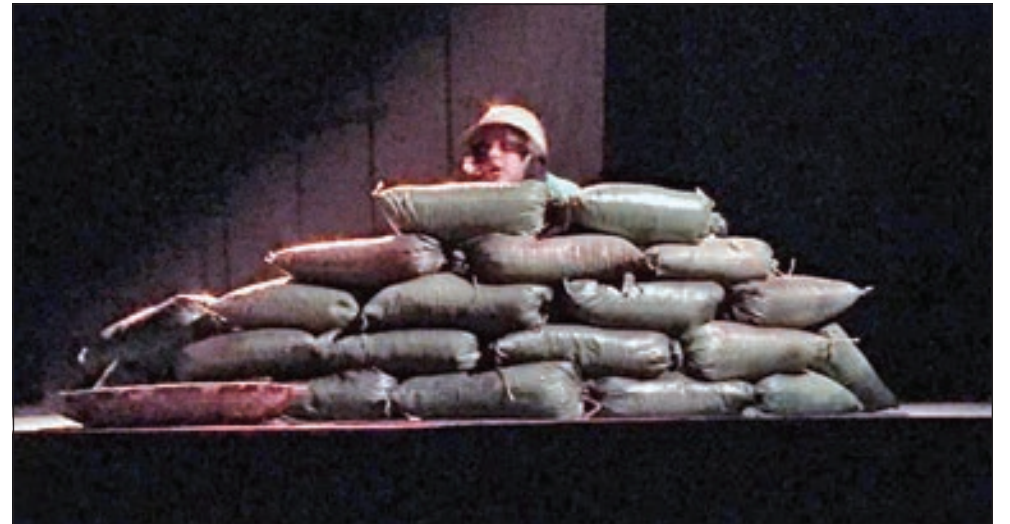
• جانب من العرض