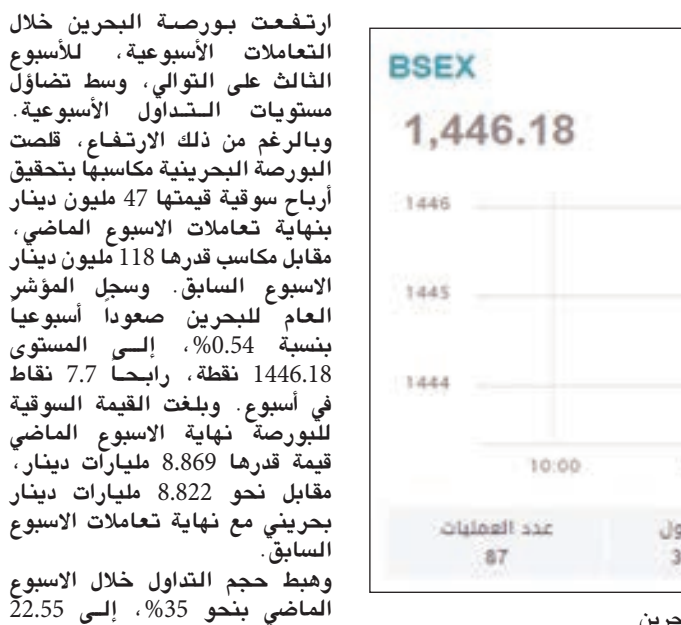
• مؤشر البحرين

ارتفعت بورصة البحرين خلال التعاملات الأسبوعية، وسط تضاؤل مستويات التداول الأسبوعية. وبالرغم من ذلك الارتفاع، قلصت البورصة البحرينية مكاسبها بتحقيق أرباح سوقية قيمتها 47 مليون دينار بنهاية تعاملات الأسبوع الماضي، مقابل مكاسب قدرها 118 مليون دينار الأسبوع السابق. وسجل المؤشر العام للبحرين صعوداً أسبوعياً بنسبة 0.54%، إلى المستوى 1446.18 نقطة، رابحاً 7.7 نقاط في أسبوع. وبلغت القيمة السوقية للبورصة نهاية الأسبوع الماضي قيمة قدرها 8.869 مليارات دينار، مقابل نحو 8.822 مليارات دينار بحريني مع نهاية تعاملات الأسبوع السابق. وهبط حجم التداول خلال الأسبوع الماضي بنحو 35%، إلى 22.55