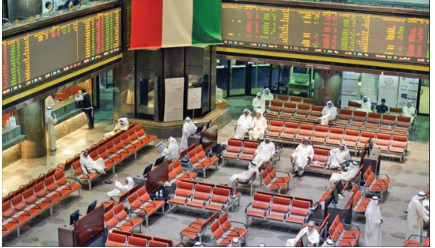
• بورصة الكويت

نجم المؤشر العام لسوق أبوظبي للأوراق المالية في تحقيق مكاسب أسبوعية؛ جاء أغلبها بقطاعي البنوك والعقار، وذلك بالتزامن مع محفزات حكومية تضمنت إصدار قانون بتعديل بعض أحكام قانون الملكية العقارية في أبوظبي، فضلاً عن قرار زيادة ملكية الأجانب بينك أبوظبي بنسبة لا تتجاوز 40%. وارتفع المؤشر العام خلال الأسبوع بنسبة 4.74% إلى مستوى 5292 نقطة بمكاسب قدرها 239.67 نقطة. ورجح رأس المال السوقي لبورصة أبوظبي نحو 21 مليار درهم، لتصل بنهاية جلسة