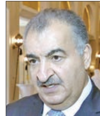
• إبراهيم حداد

بحث قمة قادة الاتصالات التي ينظمها «مجلس سامينا للاتصالات» مدى استعداد وجهوزية دول المنطقة لانطلاق شبكات الجيل الخامس وكافة متطلبات المرحلة المقبلة. وقال المدير الإقليمي للاتحاد الدولي للاتصالات إبراهيم حداد إن الاقتصاد سينظم موزنا دوليا في مدينة شرم الشيخ المصرية في نوفمبر المقبل لتنسيق الجهود بين دول المنطقة لإطلاق تقنيات الجيل الخامس. وأضاف حداد على هامش قمة قادة الاتصالات لدول جنوب آسيا والشرق الأوسط وشمال أفريقيا التي تعرف اختصارا بـ «سامينا» أن الاجتماع المزمع سيقوم بوضع الأطر القانونية لتبنيها الدول في ما يخص تطبيقها لتقنيات الجيل الخامس وتحديد النطاقات والترددات لتبني دول المنطقة بتنفيذها في عام 2020.