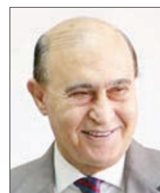
• مهاب ميش

قال رئيس هيئة قناة السويس ورئيس الهيئة العامة الاقتصادية لمنطقة القناة مهاب ميش، إن القناة حققت أعلى عائد سنوي في تاريخها عام 2018، بنسبة زيادة تقدر بنحو 8.5%، على أساس سنوي. وأوضح ميش، أن إيرادات قناة السويس سجلت 5.7 مليارات دولار خلال العام الماضي، بزيادة 450 مليون دولار عن عام 2017. وأشار الفريق ميش، إلى قدرة قناة السويس على استيعاب 100% من تجارة الحاويات البحرية ما بين آسيا وأوروبا. وأضاف ميش، أن معدلات التجارة العابرة للقناة خلال آخر 8 سنوات حققت متوسط نمو سنوي بلغ 5.4%، وهي نسبة تفوق معدل نمو التجارة العالمية الذي سجل 3.4%، وهو ما يعني زيادة أعداد وحمولات السفن العابرة وإيرادات القناة بما ينعكس على تحسن الاقتصاد القومي. وأكد أن مصر تبنت استراتيجية عمل لتعظيم الاستفادة من الموقع