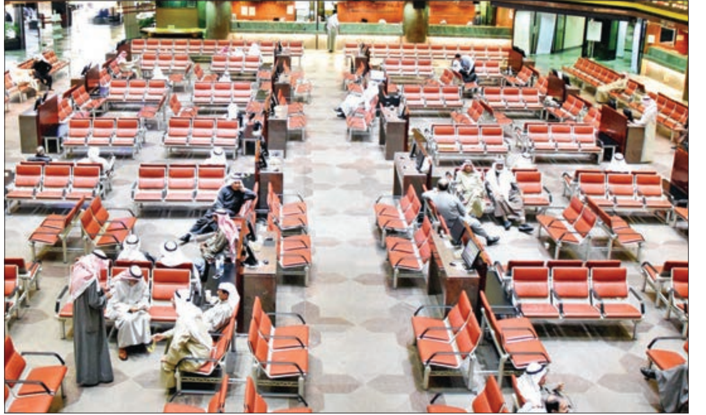
• تراجع مؤشر السوق الرئيسي 0.75%.