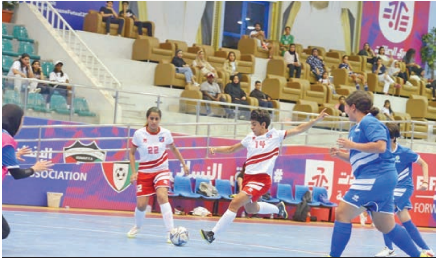
• جانب من مباراة الكويت وفور سيورت

في فوز العميد على فور سيورت وتغلب البرموك على العربي. وبعد اقتراب مواجهات الدور الاول التمهيدي من نهايتها اتضحت معالم الصورة للفرق التي حجزت بطاقات التأهل للدور نصف النهائي والمرشحة للمنافسة على اللقب، وأول هذه الفرق جاغوار ثم البرموك والكويت وسلوى الصباح ويخوض الأخير مباراة مهمة غدا السبت مع نادي الفتاة ويكفيه التعادل أو الفوز بأي نتيجة ليضمن البطاقة الأخيرة للمربع الذهبي.