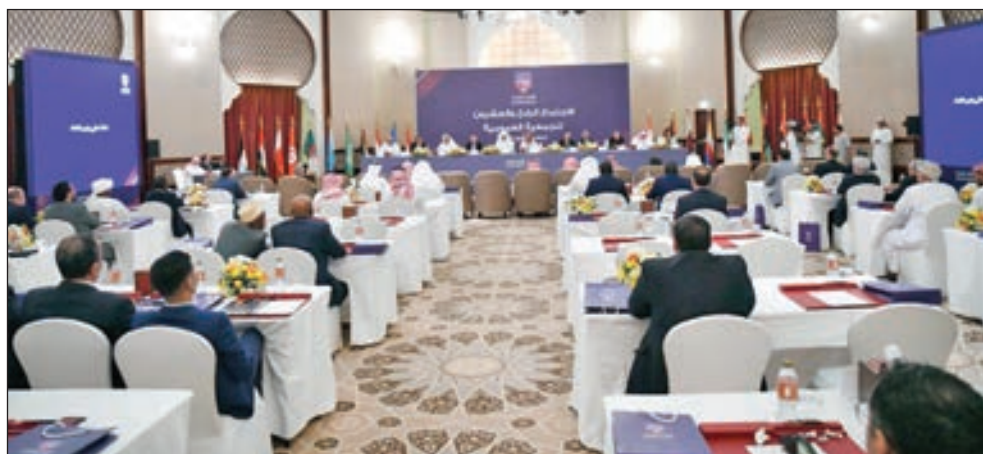
• جانب من عمومية الاتحاد العربي