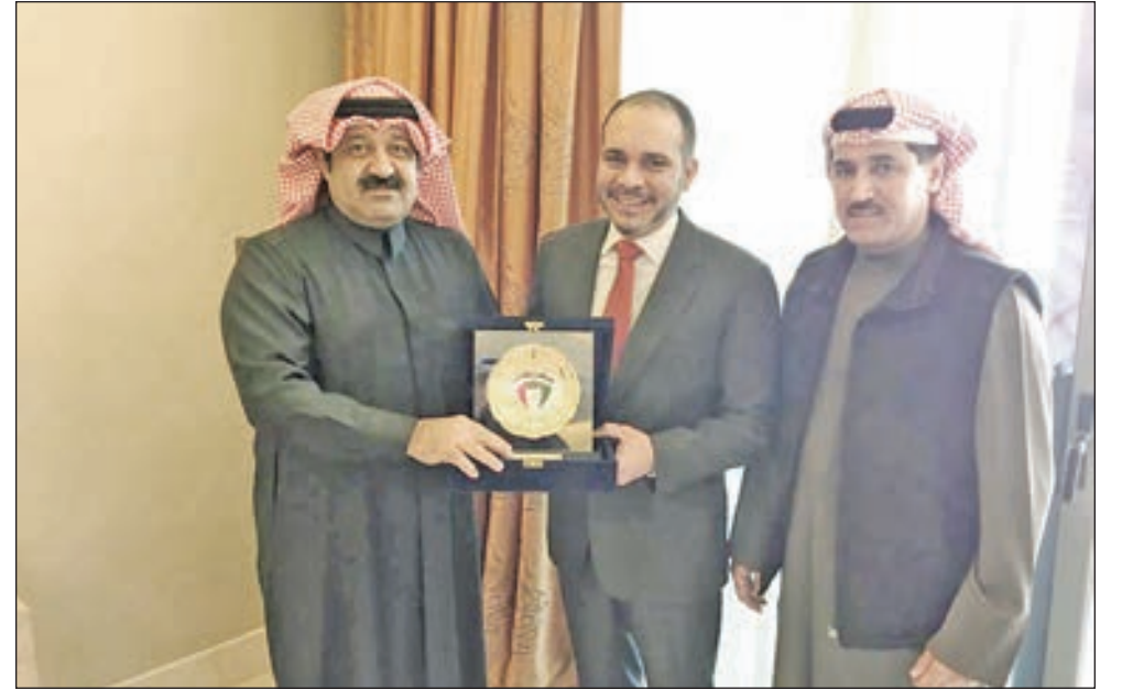
• الأمير علي متوسلا يوسف و خليل السالم في مناسبة سابقة

حدد اتحاد غرب اسيا لكرة القدم السابع والعشرين من الشهر الحالي موعدا لعقد اجتماع تنسيقي مهم مع الاتحادات المنضوية تحت لوائه والمشاركة ببطولته التاسعة التي ستعقد في العراق في شهر اغسطس المقبل. وقال امين سر الاتحاد خليل السالم في بيان له، ان اتحاده طلب من اتحادات الأردن والبحرين ولبنان وسورية والعراق وفلسطين واليمن والكويت تسمية ممثلهم لحضور الاجتماع التنسيقي الذي سيعقد في العاصمة الأردنية عمان، حيث ستتم مناقشة العديد من القضايا التي تخص استضافة العراق لبطولة الرجال التاسعة بعد الزيارات التي قامت بها لجان الاتحاد التقديرية الى المدن المستضيفة للبطولة، وهما كربلاء واربيل. واضاف السالم ان الاتحاد زود الاتحاد العراقي بتقرير مفصل يشمل جميع الاعمال التي يجب القيام بها، والمتطلبات اللازمة لاستضافة البطولة. واشار الى ان الاجتماع سيناقش ايضا نظام البطولة، حيث ستقسم الفرق المشاركة على مجموعتين، تلعب الاولى، والتي سيرأسها