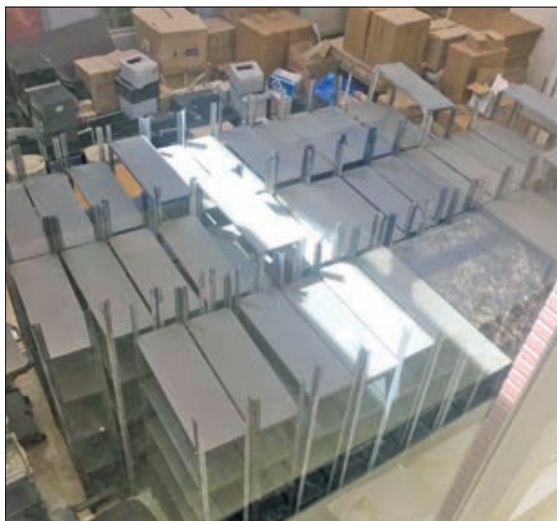
• تحويل مبنى الاستخدام الى مخزن

وطالبت المصادر قيادي الهيئة باتخاذ اجراءات صارمة تجاه أي مسؤول مقصر ولا يقوم بدوره على أكمل وجه، حتى يكون عبرة لغيره أو على الأقل تحويله الى الادارة القانونية لمعرفة