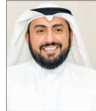
• الشيخ باسل الصباح