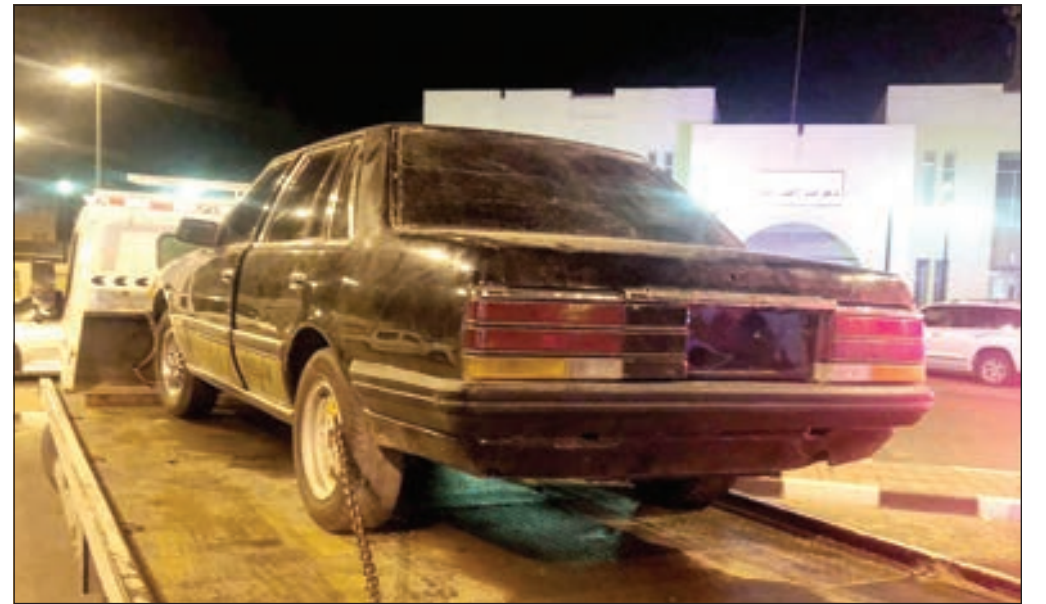
• المركبات المستخدمة في أعمال الرعونة

و على الفور انتقل رجال مخفر جابر الأحمد من قطاع الأمن العام إلى موقع البلاغ وتمكنوا من ضبط مركبتين وحجزهما بكراج المرور لارتكابهما مخالفات جسيمة، ويواصل رجال الأمن جهودهم لضبط باقي المركبات التي ظهرت بمقطع الفيديو. ودعت وزارة الداخلية المواطنين والمقيمين بالاتصال فوراً على هاتف الطوارئ 112 في حال رصد أي أعمال رعونة أو استهتار، مؤكدة أن القطاعات الميدانية بالوزارة تتصدى بكل حزم لأي محاولة للخروج على القانون.