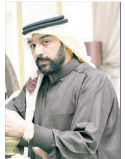
• شهاب جوهر

وأكد الفنان شهاب جوهر أنه سيشترك في ثلاثة أعمال درامية في الماراثون الرمضاني المقبل، دون أن يفصح عن تفاصيلها، وأشار الجدل عند رده على سؤال «أنت أكثر فنان مغبون «ضائع» حق»، قائلا «لأن اشتغل بمزاج وما يجب اتعلق للمنتجين».