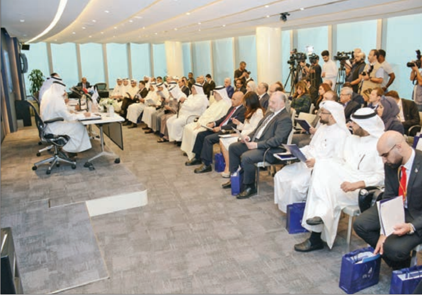
* جانب من العمومية

بقوة وعلى نطاق واسع لتلبية احتياجات ومتطلبات عملائنا الكرام، وتجاوز توقعاتهم، والحفاظ على موقعنا الريادي في الأسواق الرئيسية التي نتواجد بها، والمثابرة بشكل متواصل لتبني مركز متقدم في صناعة التأمين العربية، مع العمل على تحقيق معدلات نمو قوية ومستمرة في السنوات المقبلة والحفاظ على مصالح مساهميننا وعملائنا وموظفينا وسعيًا لتقوية التصنيف الائتماني لشركات المجموعة والاستثمار في التكنولوجيا الرقمية لتطوير عمليات المجموعة، وسوف تستمر المجموعة في سعيها نحو اغتنام الفرص الاستثمارية الجيدة للتوسع في تواجدها الإقليمي، كما ستستمر في مواصلة عملها المكثف للاستثمار في الموارد البشرية لتعزيز وصقل الخبرات والقدرات الفنية والإدارية لموظفيها كما سيستمر في تطوير وتطبيق أنظمة الحوكمة والشفافية عبر المجموعة واحترام التشريعات وأنظمة الرقابة في كافة شركات المجموعة، وسواصل العمل على تطوير شبكة فروعها الداخلية والخارجية واستخدام أفضل وسائل التكنولوجيا في تسويق وتطوير خدماتها ومنتجاتها لعملائها الكرام..