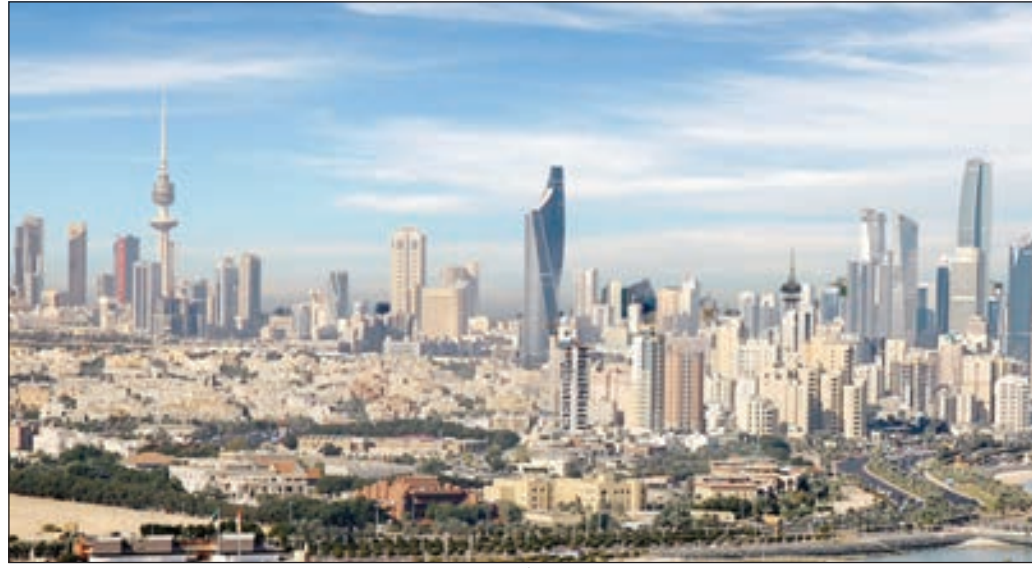
* الإمارات تصدرت الدول الأكثر استيراداً للصادرات المحلية بقيمة 10 ملايين دينار

وأفادت بأن الدول الأجنبية التي استوردت من الكويت شملت فرنسا وأوكرانيا وإسبانيا وبولندا وسلوفينيا وغويانا والهند واليونان وكينيا وقبرص وأثيوبيا والسويد وبنين وبنغلاديش وسريلانكا بقيمة إجمالية بلغت 682.3 ألف دينار «نحو 2.2 مليون دولار». وذكرت أن الصادرات إلى الدول غير العربية تنوعت بين البولي إيثيلين والمواد الكاوية وقشور ومنتجات قوم وسيليكون وحلويات وديجاج وحبيبات بلاستيكية.