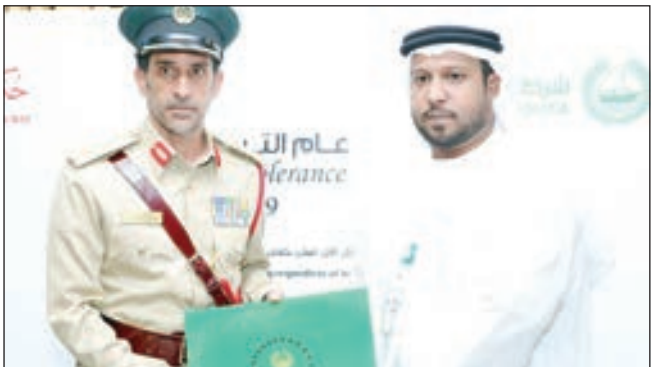
• خلال التكريم

وأغراه بمبلغ 30 ألف درهم وسيارة، إضافة إلى راتب شهري 50 ألف درهم، مقابل إخباره بموعد مدهامة أفراد القسم للأشخاص الذين يتاجرون بالخمر في تلك المنطقة، حتى لا يتم إلقاء القبض عليهم متلبسين بهذه الجريمة. ولم ينجح المخبر في إغراء الشرطي، حيث تغلبت على الأخير نزاهته وأمانته وإخلاصه لعمله، الأمر الذي دفع القائد العام لشرطة دبي، اللواء عبد الله المري، إلى ترفيقه إلى الرتبة التي تلي رتبته الحالية، ومنحه هدية عينية، وشهادة تقدير، تكريماً له على نزاهته وأمانته وإخلاصه في عمله.