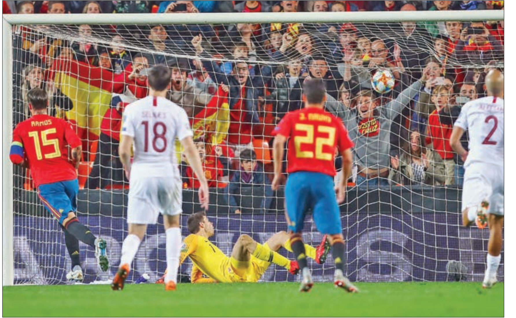
• راموس يسجل في مرمى النرويج

سيبايوس، ورودريغو بدلا من داني باربخو، من أجل السيطرة بشكل أكبر على الكرة، وغلقت الثغرات أمام الخصم، ومساندة خط الدفاع. وأصدر ماركو أسينسيو فرصة تسجيل الهدف الثالث، حيث انفرد بحارس النرويج، لكنه سدد برعونة أعلى المرمى في الدقيقة 90. وعانى لاروخا من عدم استغلال الفرص، حيث حاول لاعبو النرويج الضغط في الدقائق الأخيرة لتعديل النتيجة، لكن دون فاعلية تذكر، لتنتهي المباراة بفوز إسبانيا 2-1.