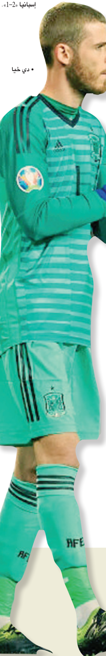
• دي خيا