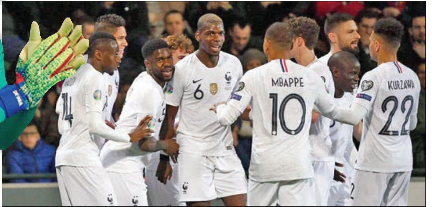
• فرحة لاعبي فرنسا بعد تسجيل هدف

نظيفة، ولكن الفريق سيخرج إلى الجبل الأسود اليوم من أجل لقاء جديد، سيكون سهلاً بشكل نسبي، خصوصا أن الفريق الإنكليزي لديه كافة العوامل من لاعبين للانتصار على المنافس السهل بشكل نسبي. وفي باقي المباريات يلتقي تركيا مع مولدوفا وكوسوفو مع بلغاريا والبرتغال مع صربيا ولوكسمبورغ مع اوكرانيا واندورا مع البانيا.