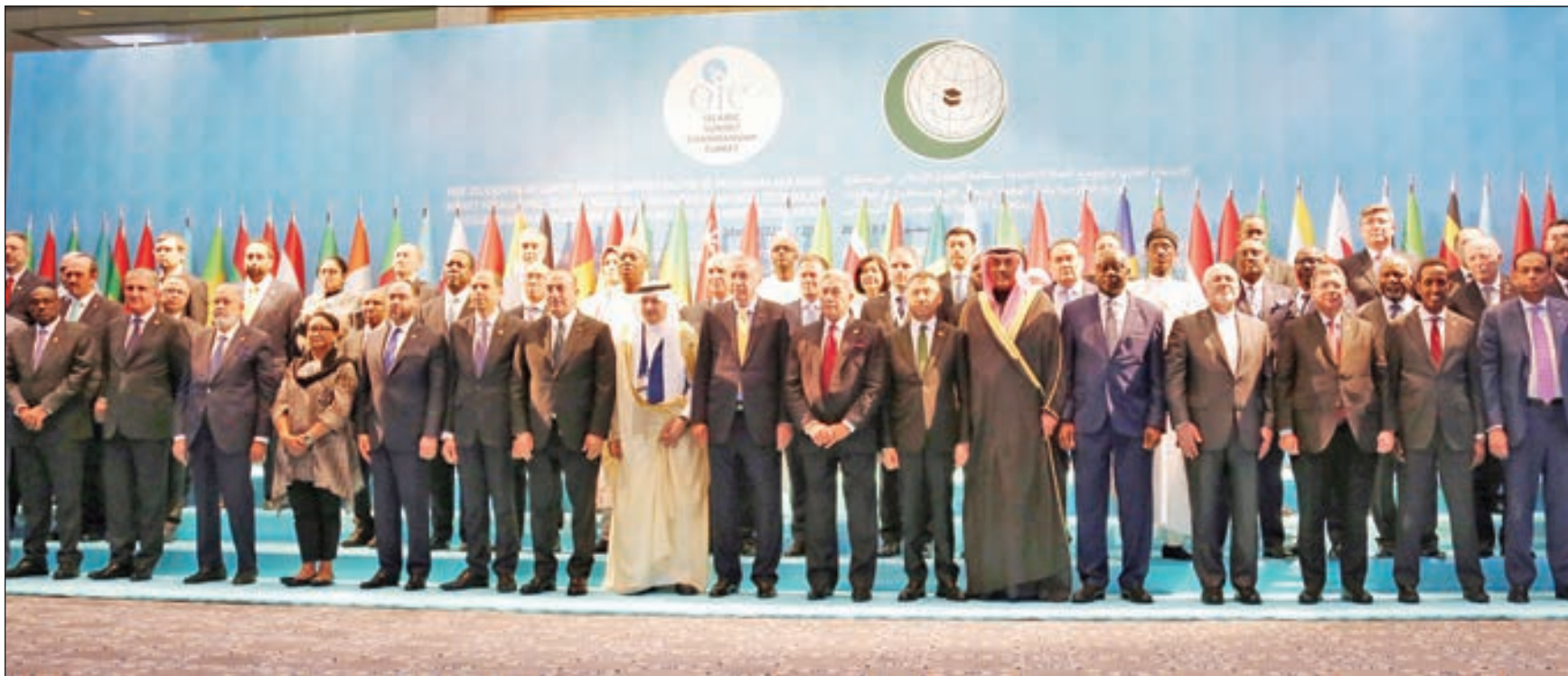
... ومع المشاركين في الاجتماع