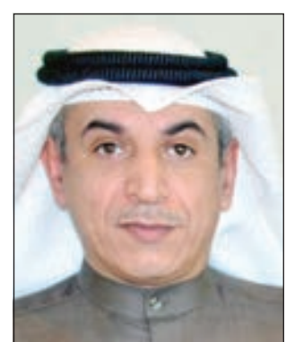
• حامد العازمي

أكد وزير التربية والتعليم العالي حامد العازمي أن آلية الاستعانة بالمستشارين الكويتيين وبخدماتهم في وزارة التربية تتم بعد مخاطبة ديوان الخدمة المدنية، وكذلك بعد موافقة المؤسسة العامة للتأمينات الاجتماعية.