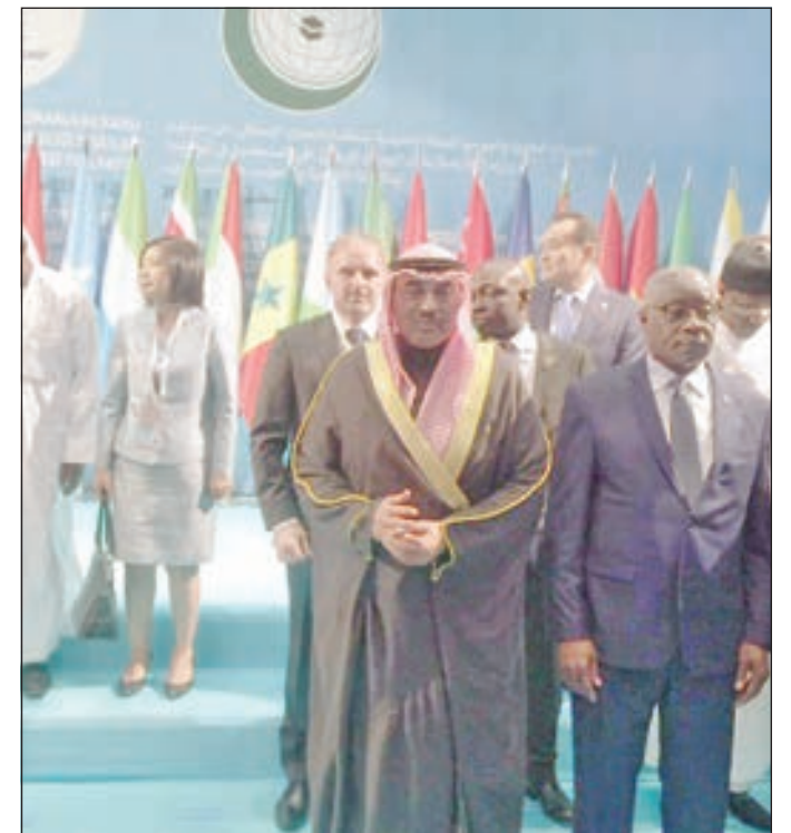
• الشيخ صباح الخالد خلال مشاركته في اجتماع منظمة التعاون الإسلامي