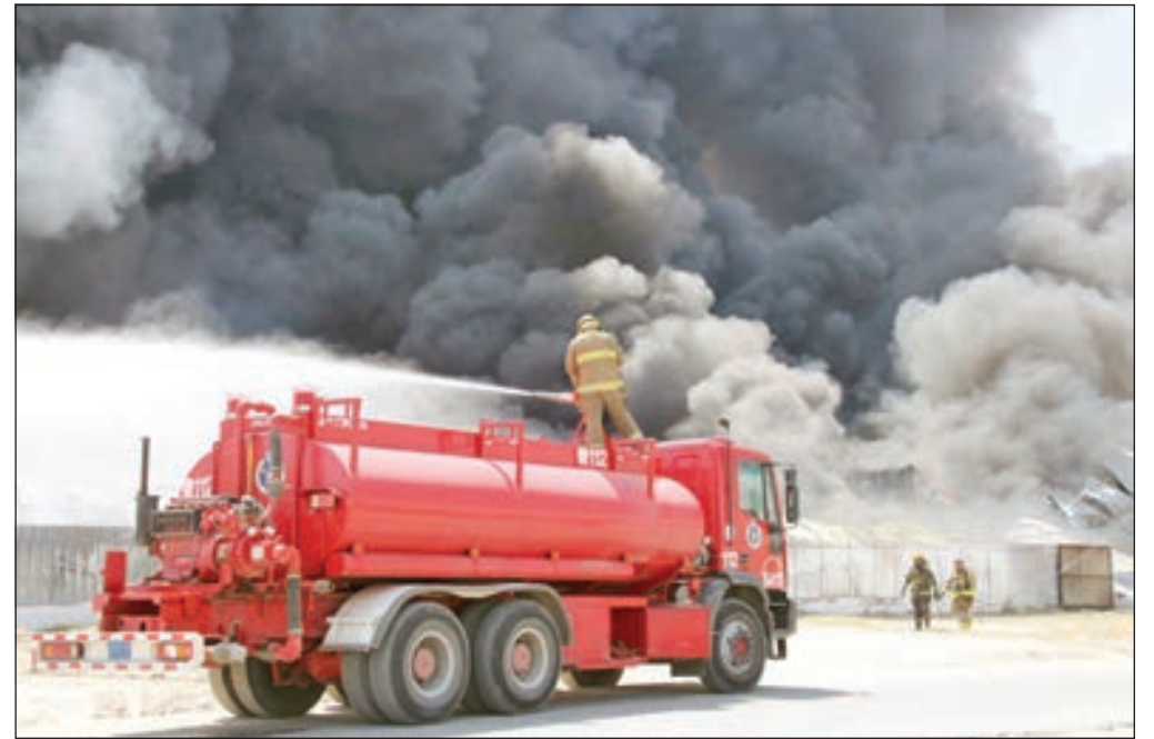
• أثناء مكافحة الحريق

يفيد باندلاع حريق في مستودعات تحتوي على فحم وملابس ومواد بترولية سائلة وأخشاب بمساحة 4 آلاف متر مربع، وإثر ذلك توجهت فرق الإطفاء من مراكز الصليبيات وجيب الشيوخ وصحان ومشرف ومبارك الكبير للمواد الخطرة والإسناد والجبراء والغروانية والهلال للتعامل معه ومكافحته.