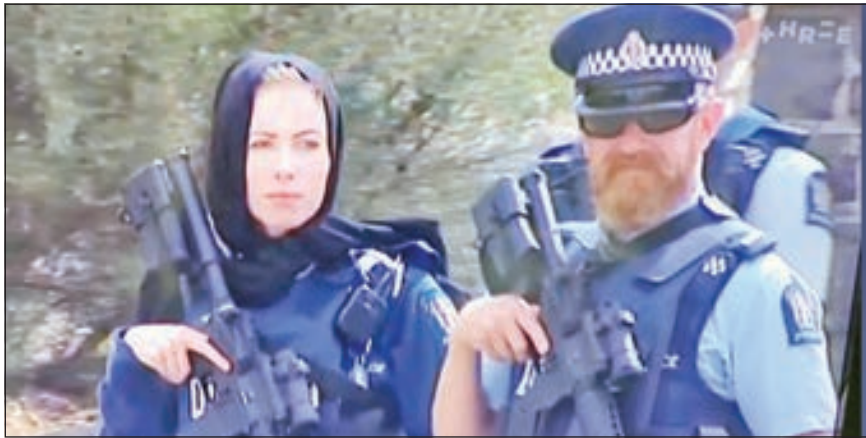
• الضابطة بالحجاب الإسلامي

تضامن الآلاف أمس حول العالم ووقفوا دقيقة صمت حدادا على أرواح الضحايا، الذين قتلوا في هجوم إرهابي استهدف مسجدين في نيوزيلندا يوم الجمعة الماضي، وفي أستراليا وقف المسافرون في مطار سيدني دقيقة صمت تضامناً مع عائلات ضحايا الهجوم، وتزامن التضامن مع وقفة صمت لدقيقتين جرت في عموم نيوزيلندا خلال مراسم تأبين ضحايا مجزرة المسجدين، حيث لبست ضابطة شرطة حجاباً تضامناً مع أهالي القتلى.