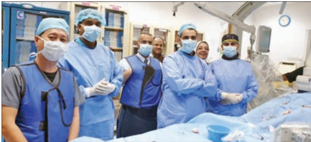
• الفريق الطبي بعد إجراء عملية التركيب