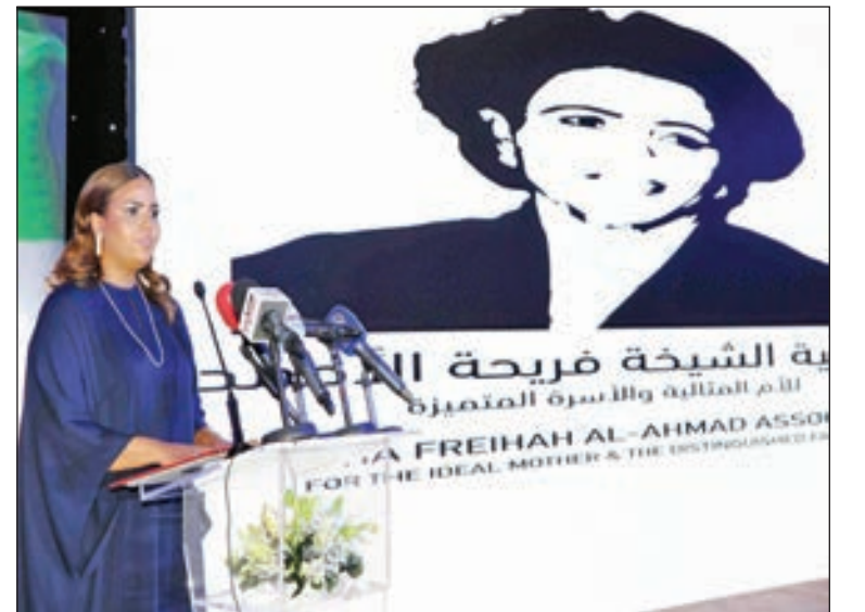
• الشبخة ريم الصباح تلقي كلمتها

فريحة الأم الأم المثالية صالح النهام معايير الجائزة التي تشمل المعيار الشخصي والثقافي والأخلاقي والأسري. واستذكر النهام الدور الرائد الذي قامت به الراحلة الشبخة فريحة الأم صاحبة فكرة الجائزة التي كانت تهدف إلى المساهمة في خدمة المجتمع ونشر الفكر الطوعي والتسامح والقيم الأخلاقية الأصيلة وجعله ركيزة أساسية في كيان الفرد والأسرة والمجتمع. بعد ذلك تم عرض فيلم وثائقي عن الراحلة الشبخة فريحة الأم وإلقاء عدد من القاصد الشعرية تم تكريم عدد من الشخصيات والأمهات المثاليات.