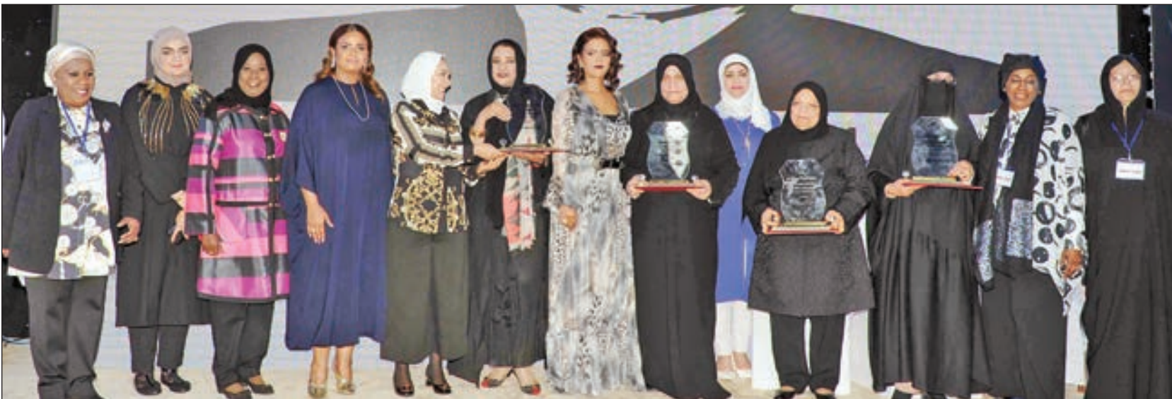
• كبار الحاضرات مع الفائزات