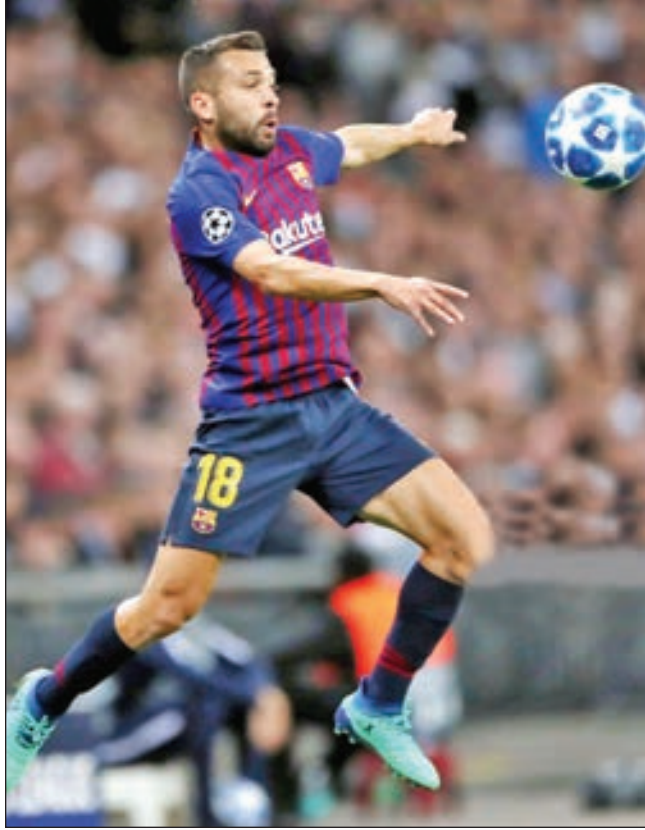
• جوردني ألبا

قال جوردني ألبا، ظهير برشلونة، إنه سيكون من حماقة أن يخسر فريقه لقب الدوري الإسباني، هذا الموسم، بعدما حقق تفوقاً كبيراً على المنافسين.