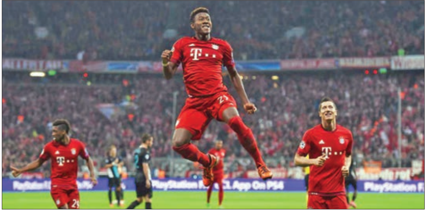
• ألبا يحتفل بأحد أهدافه

والبريميرليغ، هناك عملاقان كبيران في إسبانيا، من الممكن اللعب للريال أو البرشا، جديدة، والضغط يكون حاضراً بشكل دائم، لهذا السبب أنا سعيد في بايرن ميونخ، لكن من الممكن أن أتطلع لخوض تجربة جديدة في المستقبل».