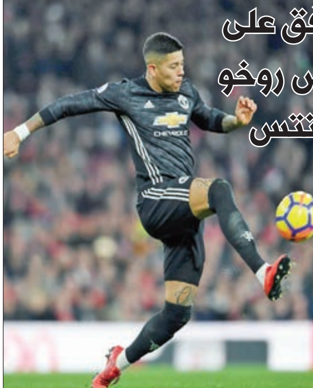
• ماركوس روخو

سمح نادي مانشستر يونايتد، لمدافع الشياطين الحمر بالعودة إلى مسقط رأسه، والتدرب مع فريقه السابق، بعدما فقد فرصة اللعب في تشكيلة المدرب التروجيغوي أولي جونار سولسكاير.