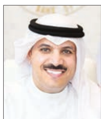
• محمد الهاشل

انطلقت أعمال الاجتماع الـ 72 للجنة محافظي مؤسسات النقد والبنوك المركزية بدول مجلس التعاون الخليجي أمس لبحث الحضور المشترك مع بعض المجموعات والكتلت الاقتصادية. وأكد الرئيس التنفيذي للبنك المركزي العمري ورئيس الاجتماع طاهر العمري في كلمة افتتح بها الاجتماع أن الاجتماع يأتي لمواصلة مسيرة التعاون والتكامل بين دول المجلس، مشيراً إلى أهمية هذه الاجتماعات في إتاحة الفرصة لتبادل التجارب والخبرات والتنسيق بين السلطات النقدية في دول المجلس على جاذبيته كوعاء للمدخرات القومية وتوفير التمويل اللازم للقطاع الخاص، إضافة إلى المساهمة في تمويل عجز الميزانيات الحكومية مشيراً إلى الدور المهم الذي قامت به السلطات النقدية والبنوك المركزية في المنطقة من حيث الأطر الرقابية المحكمة «وملازمة» السياسات النقدية المتخذة مع المعطيات الجديدة. ويترأس الوفد الكويتي المشارك بالاجتماع محافظ بنك الكويت المركزي الدكتور محمد الهاشل.