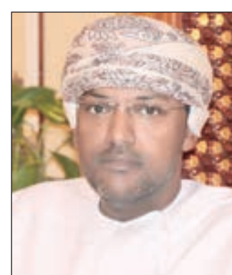
• طاهر العمري

انطلقت أعمال الاجتماع الـ 72 للجنة محافظي مؤسسات النقد والبنوك المركزية بدول مجلس التعاون الخليجي أمس لبحث الحضور المشترك مع بعض المجموعات والكتلت الاقتصادية. وأكد الرئيس التنفيذي للبنك المركزي العمري ورئيس الاجتماع طاهر العمري في كلمة افتتح بها الاجتماع أن الاجتماع يأتي لمواصلة مسيرة التعاون والتكامل بين دول المجلس، مشيراً إلى أهمية هذه الاجتماعات في إتاحة الفرصة لتبادل التجارب والخبرات والتنسيق بين السلطات النقدية في دول المجلس على جاذبيته كوعاء للمدخرات القومية وتوفير التمويل اللازم للقطاع الخاص، إضافة إلى المساهمة في تمويل عجز الميزانيات الحكومية مشيراً إلى الدور المهم الذي قامت به السلطات النقدية والبنوك المركزية في المنطقة من حيث الأطر الرقابية المحكمة «وملازمة» السياسات النقدية المتخذة مع المعطيات الجديدة. ويترأس الوفد الكويتي المشارك بالاجتماع محافظ بنك الكويت المركزي الدكتور محمد الهاشل.