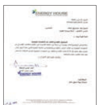
• إفصاح بيت الطاقة

أعلنت شركة بيت الطاقة حصولها على 19.98 مليون دولار، جراء استحواذ شركة يونابتد كويت إنيرجي على كامل أسهم بيت الطاقة. وسيتم الاعتراف بها في تخفيض الخسائر المتراكمة.