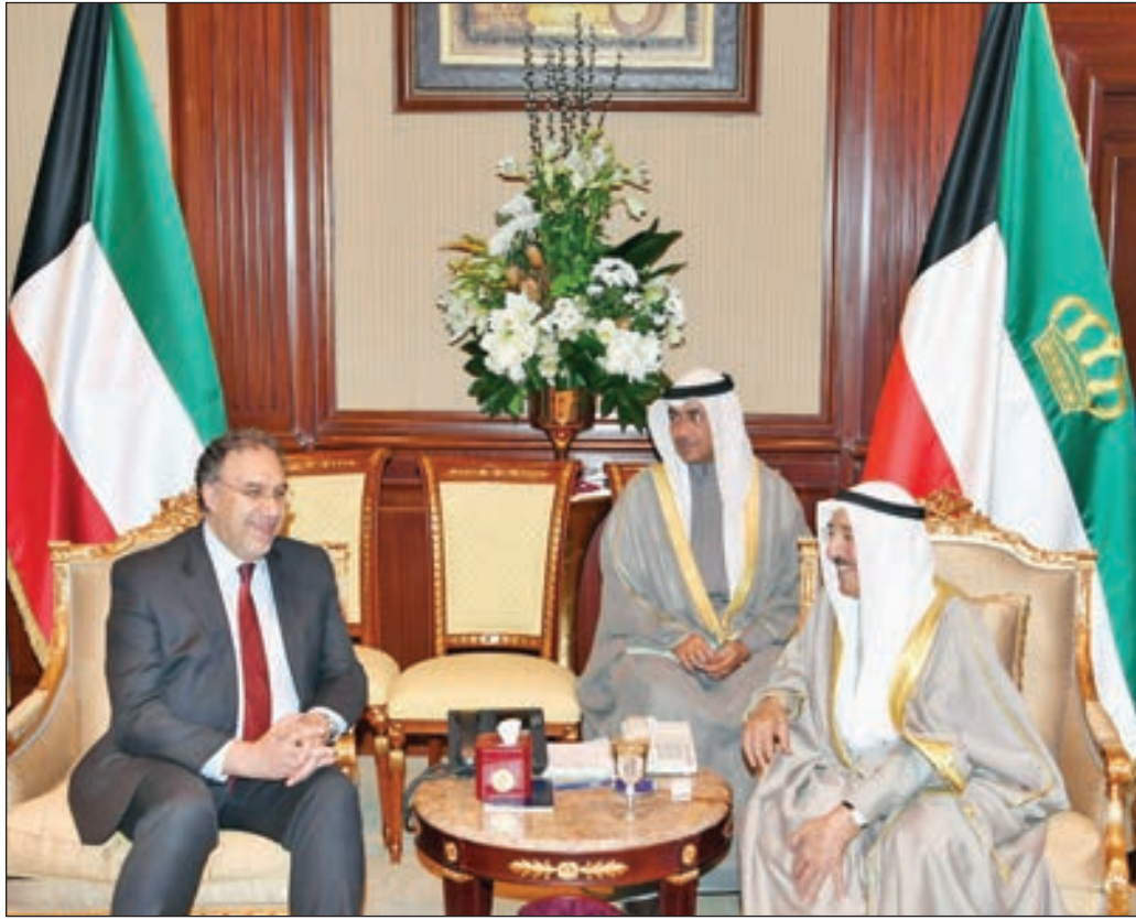
• ... ولدى استقباله وزير الكهرباء العراقي لؤي الخطيب