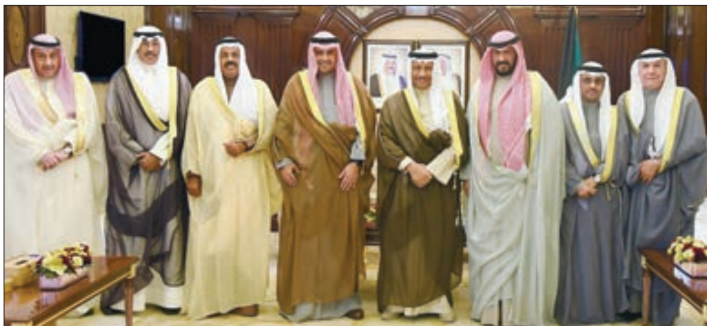
• سمو الشيخ جابر المبارك مستقبلاً أنس الصالح والمحافظين

استقبل سمو الشيخ جابر المبارك رئيس مجلس الوزراء، في قصر بيان أمس، نائب رئيس مجلس الوزراء وزير الدولة لشؤون مجلس الوزراء أنس الصالح، حيث قدم لسموه محافظ حولي الفريق الخالد، ومحافظ العاصمة الشيخ طلال الخالد، ومحافظ الفروانية الشيخ فيصل الحمود، ومحافظ الجھراء ناصر الحجرف، وذلك بمناسبة تعيينهم في مناصبهم الجديدة. وقد هنأهم سموه، مؤكداً أنها وسام شرف عظيم ودافع كبير لمزيد من العمل والاجتهاد. وقال سموه إن للمحافظ دوراً كبيراً في الإشراف على تنفيذ سياسة الدولة ومتابعة مشروعات خطة التنمية في إطار محافظته، مشيراً إلى ضرورة التنسيق مع