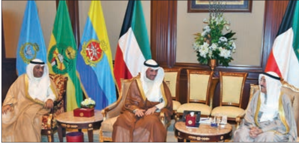
• صاحب السمو مستقبلاً مرزوق الغانم ويدر الملا