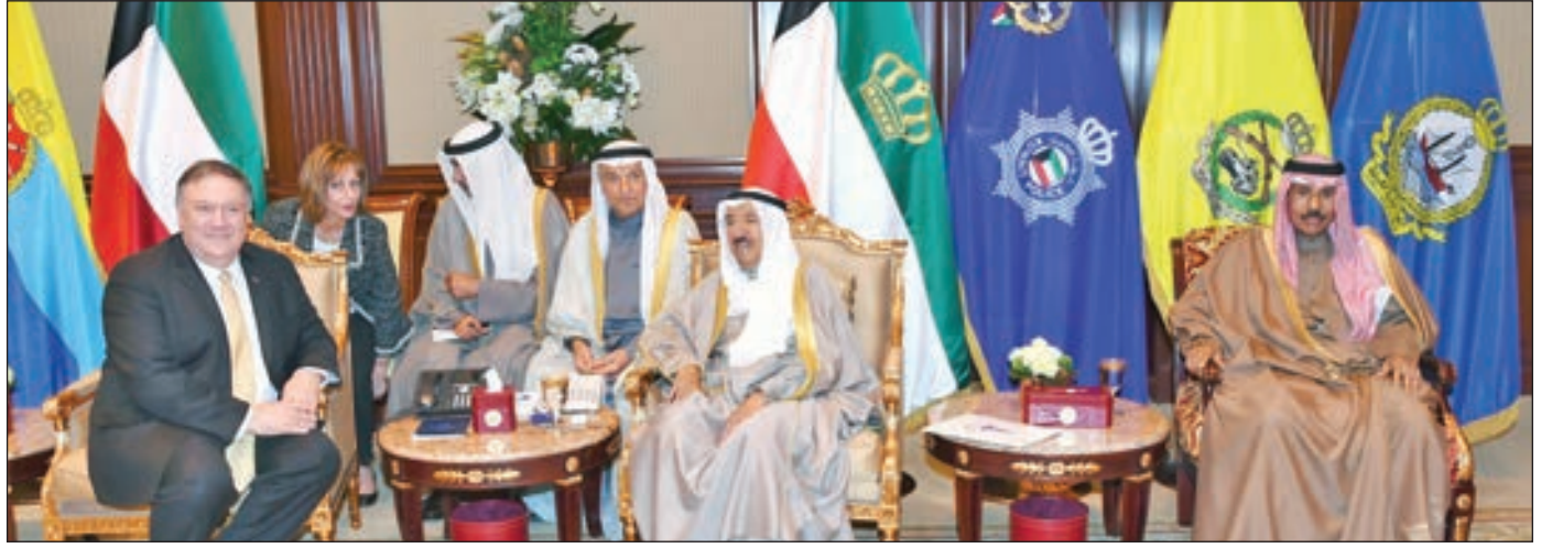
• سمو أمير البلاد مستقبلاً مايك بومبيو بحضور سمو ولي العهد

سموه استقبل ولي العهد والمبارك والغانم وعدداً من الشخصيات