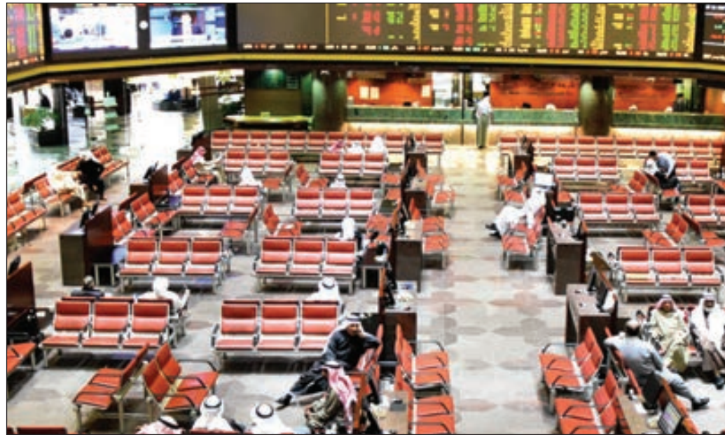
• صعود مؤشرات البورصة