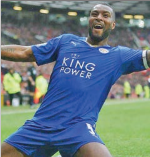
• ويس مورغان

قالت إدارة نادي ليستر سيتي الإنجليزي، إنها جددت عقد المدافع ويس مورغان لعام آخر، ليبقى ضمن صفوف الثعالب حتى نهاية موسم 2019 - 2020.