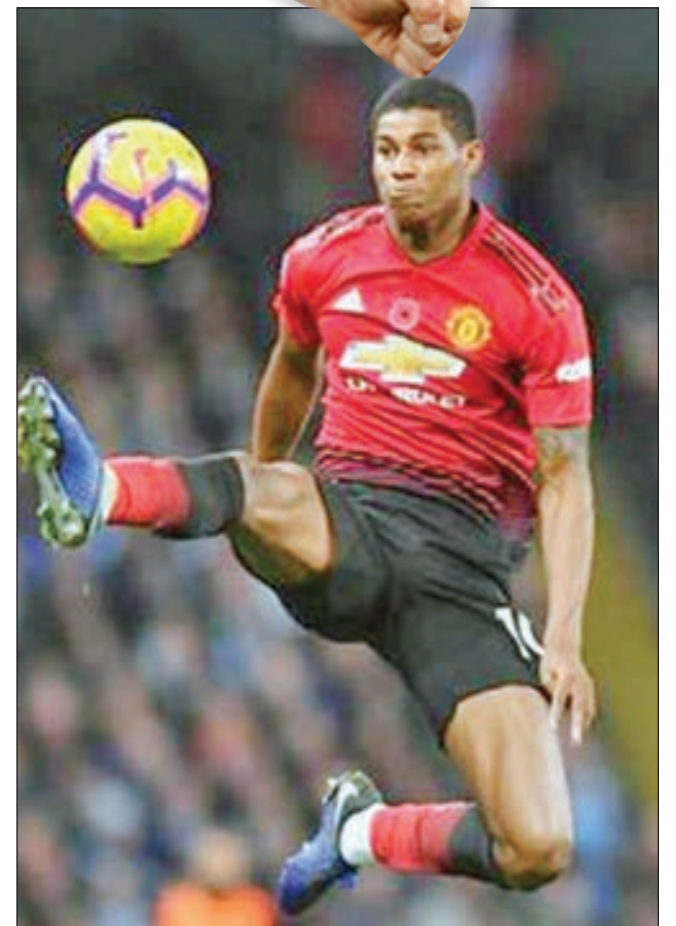
• راشفوردي يسيطر على الكرة

اختار ماركوس راشفوردي، نجم مانشستر يونايتد، أفضل 3 مهاجمين في البريميرليج، من وجهة نظره. وقال راشفوردي، خلال تصريحات نقلتها صحيفة «ميرور» البريطانية: «أعتقد أن أفضل مهاجم صريح هو سيرجيو أغويرو، حتى إذا كان مستواه ليس في أفضل حال، بإمكانه تسجيل 3 أو 4 أهداف». هذه السمة الأبرز التي أريد الحصول عليها».