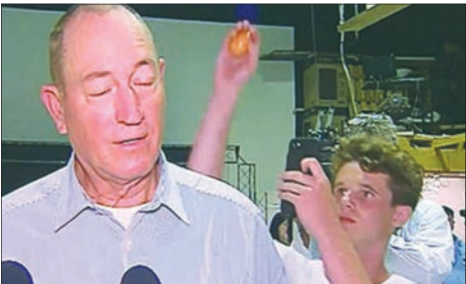
• الطفل الأسترالي يرشق السيارات بالبيضة

يحضر الأنشطة الفنية. وكان هجوم دام نفذه شاب أسترالي من اليخين المتطرف على مسجدين في نيوزيلندا قد أودى بحياة خمسين شخصاً إلى جانب العشرات من الجرحى، في أكبر اعتداء من نوعه في البلد الآمن.